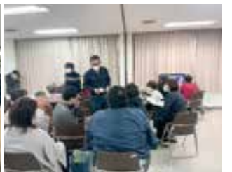
eスポーツ体験会は、多くの参加者でにぎわいました