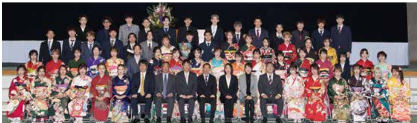
宇土東小・走潟小校区(鶴城中学校)