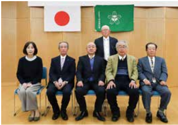
受賞者のみなさん