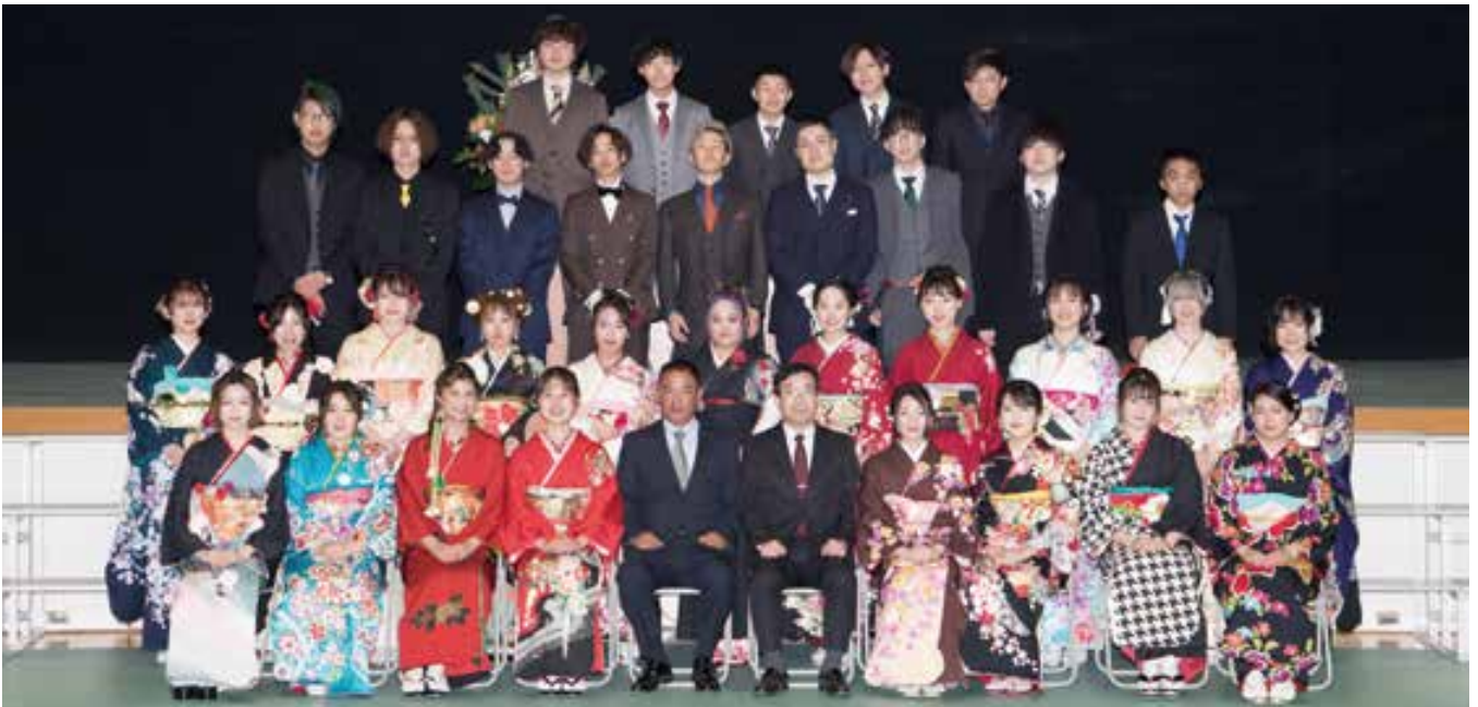
緑川小・網津小校区(住吉中学校)