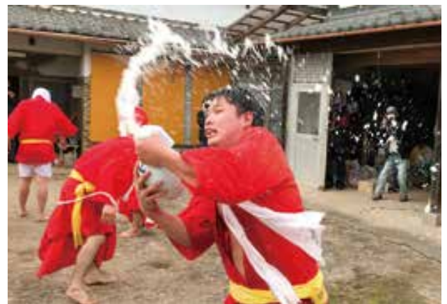
とつくりを奪い甘酒を周囲に振りまく猿

12月14日(火)、猿に扮した若者が甘酒を掛け合う市指定無形民俗文化財の「山王さん祭り」が、花園町の佐野地区で開催されました。この祭りは700年続く伝統行事で、今年は新型コロナウイルス感染症の影響で中止されたため、2年ぶりの開催となりました。祭りでは、20代～30代の6人が赤い着物に白い手ぬぐい姿で猿に扮し、境内や氏子宅で「ホーライ、ホーライ」と声を上げ、甘酒の入ったとつくりを奪い合いました。この甘酒にかかると1年間無病息災で過ごせると言われており、猿がとつくりの甘酒を周囲に振りまくと、見物客から歓声が上がりました。