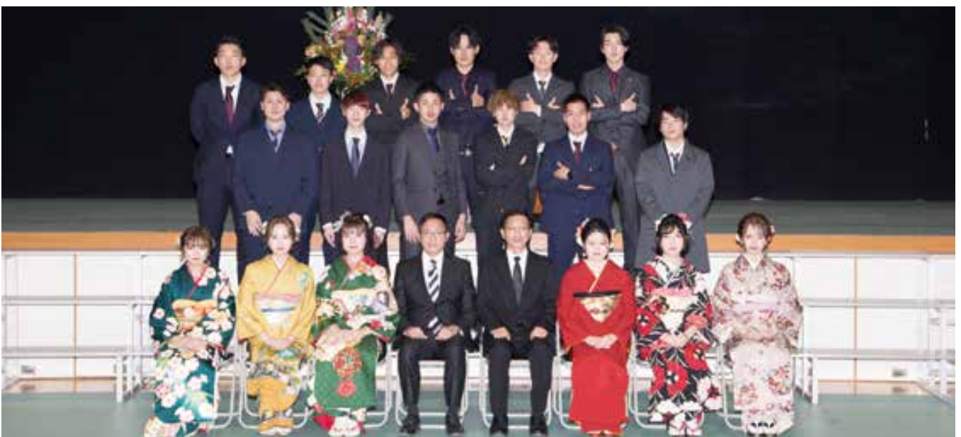
網田小校区(網田中学校)