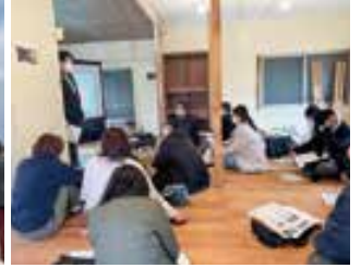
長部田海床路を紹介し、事例発表会を開催しました