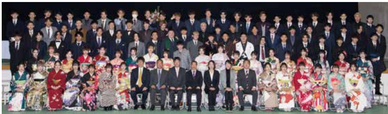
花園小校区(鶴城中学校)