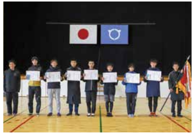
優勝した宇土地区のみなさん

1月10日(月・祝)、第47回宇土市地区対抗駅伝が市内一円で行われました。駅伝は、市運動公園をスタートして、花園、轟、緑川を經由し、走潟を折り返して運動公園をゴールとする7区間25.9kmのコースで、7地区すべてのチームが参加しました。レースは、宇土地区が2区の区間で花園地区、網津地区、網田地区をかわしてトップへ立つと、そのまま抜群の走りを見せゴール。2位の花園地区に7分5秒の差をつけ優勝しました。昨年より大幅にタイムを縮めた緑川地区には、躍進賞が贈られました。