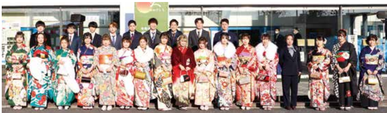
運営スタッフのみなさん