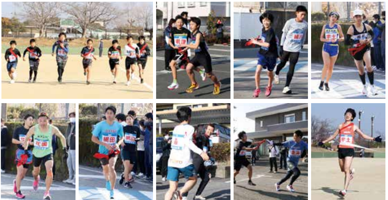
第47回宇土市地区対抗駅伝競走大会結果