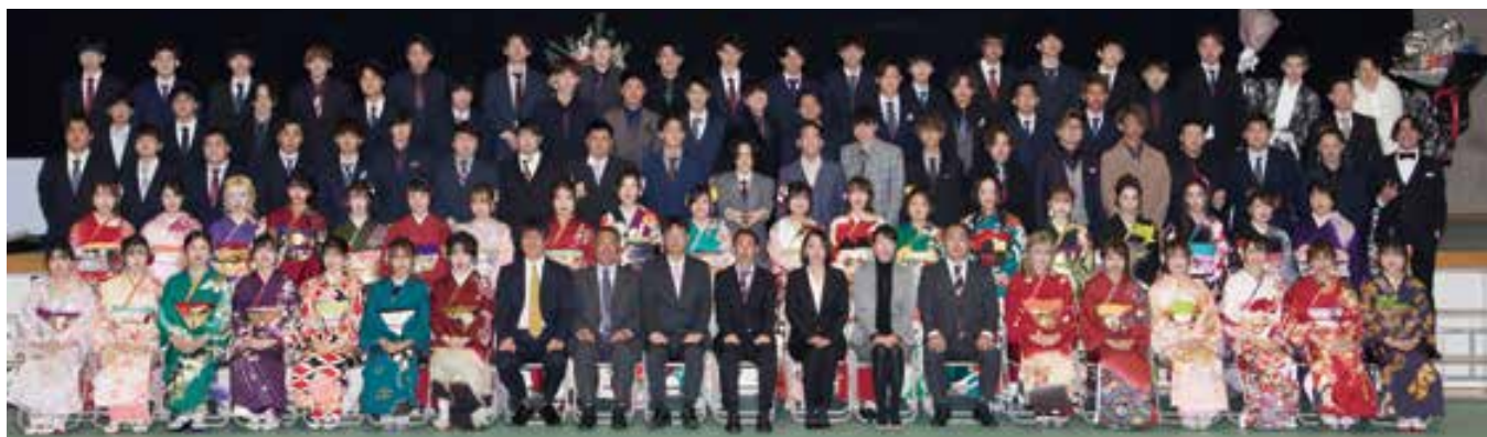
宇土小校区(鶴城中学校)