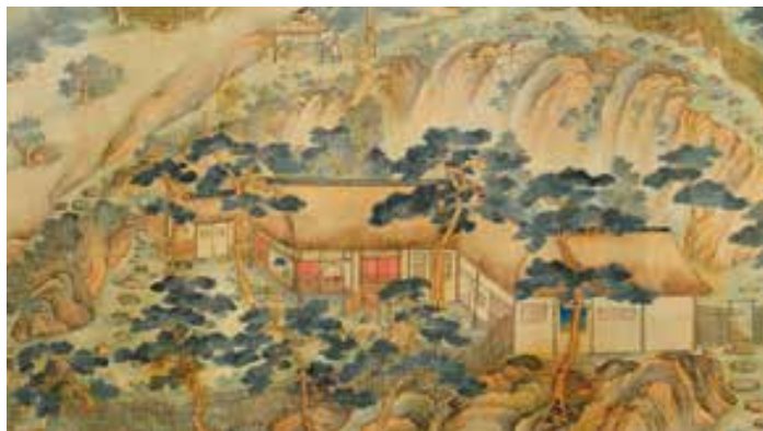
月翁が晩年を過ごした蕉夢庵