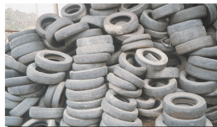
廃プラスチック類