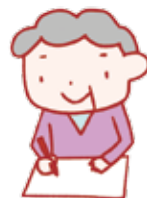
図2 健康食品手帳の例