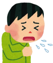
せきが2週間以上続く

せきやたんが出る、微熱が続くなど、結核の症状は風邪によく似ています。結核は、せきやくしゃみとともに飛び散った結核菌が空気中をただよび、それを吸い込むことで感染します。結核にかかっていることに気づかず治療が遅れると、病状を悪化させてしまうだけでなく、知らないうちに周りの人に感染させることもあります。感染した人すべてが発病するわけではありませんが、発病した場合でも、きちんと治療すれば治る病気です。また、患者の経済的負担を軽減させるため、医療費の公費負担制度も整備されています。