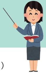
さんかもうしこみよう (参加申込用QRコード)

い か ほうほう もう こ 以下のいずれかの方法により、申し込みをしてください。