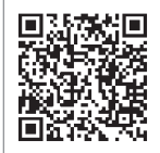
シンポジウム QRコード

どなたでも参加できますが、申し込みが必要になりますので、右のQRコードまたは「熊本県夜間中学シンポジウム」で検索してご確認ください。