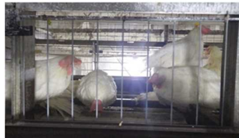
※平成28年熊本県HPAI発生鶏