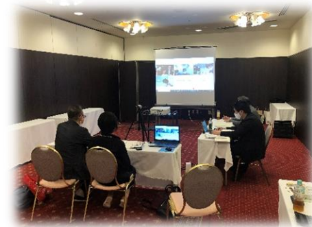
オンライン商談会