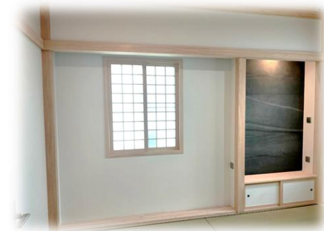
〔タイに設置したモデルルーム〕