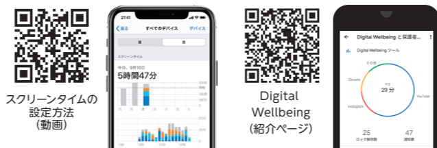
スクリーンタイムの設定方法(動画)

デジタルウェルビーイング Digital Wellbeing (Android10以上)