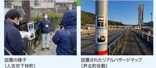
設置の様子 (人吉市下林町)

県南地域では、自主防災組織と市町村が連携し、建物や電柱などに想定浸水深や避難場所等を明示する標識「リアルハザードマップ」の整備が進んでいます。