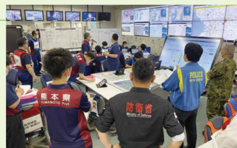
県防災センターの様子