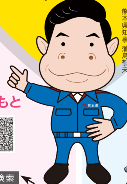
熊本県知事 浦島郁夫