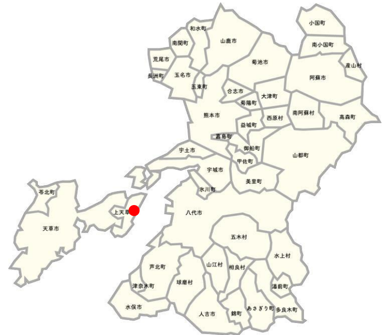
農地集積加速化事業 平成25年度指定地区