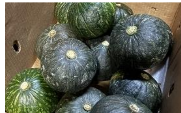
令和3年度に収穫されたかぼちゃ