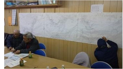
ビジョン検討会議の様子