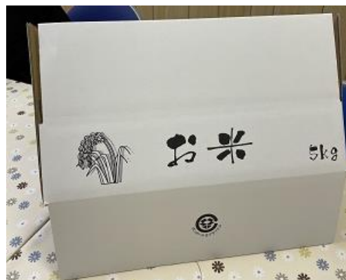
ふるさと納税返礼品送付用の箱

現在も教良木産の米は、上天草市のふるさと納税の返礼品に選ばれている。遠くは関東や関西からの申し込みもあり、新型コロナウイルス感染症拡大により、人の往来が制限される中、地域を代表する特産品として、米が地域の魅力を発信している。