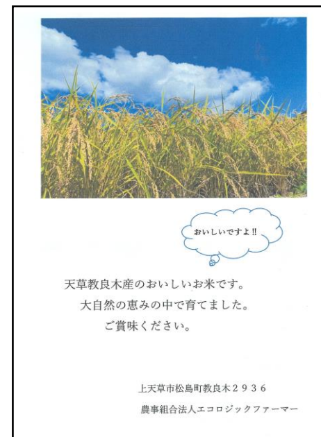
ふるさと納税返礼品のお米に同封しているお手紙