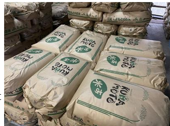
上天草市内の小中学校に給食用のお米として出荷される白米