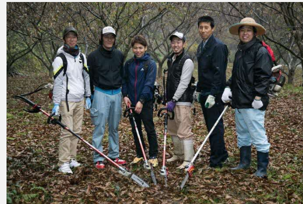
← 西岳農林ロマン部会 による剪定作業。

3年前に熊本県のモデル事業として発足した『西岳農林ロマン部会』があり、現在も高齢化が進んでいる栗農家の手助けとなっている。