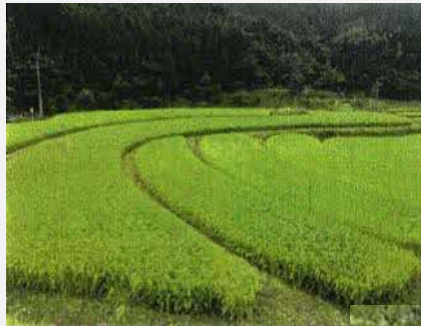
← 基盤整備前の水田。複数の区画に分かれている。

1年目は6枚を1枚にし、28.9aの面積にし、用水路を75mに延長した。平成30年は1箇所、令和元年は3箇所の施工を行った。