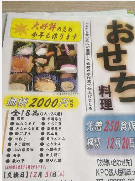
← NPO法人『岳間ほっとネット』オリジナルのおせち。

NPO法人『岳間ほっとネット』オリジナルのおせち(一人用2000円)の一品としてテストマーケティングをする。評判が良ければ商品化への検討をする。また栗の甘酒も試作し、地域の交流の場『ほっと岳間』で定期的開催されるマルシェで試飲会を行なった。ほかにも茶の加工品として、山鹿羊羹の抹茶バージョンや、柚子フレーバー茶を試作している。