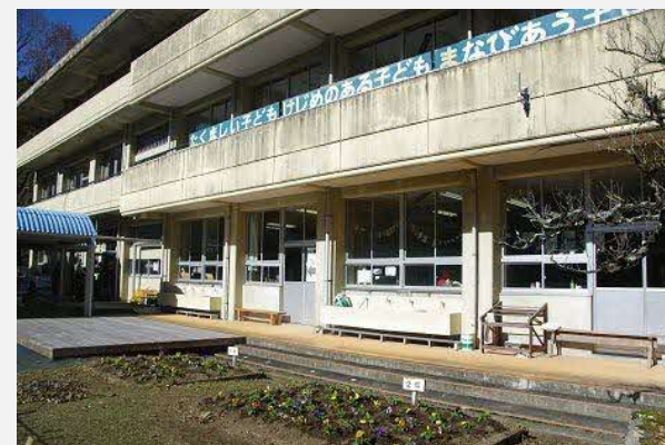
ほっと岳間 閉校した岳間小学校を、地域の交流の場『ほっと岳間』として活用。