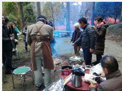
観光モニターツアー

その他にも、農業体験ツアーなどの観光プラン調査・実施を行った(現在も進行中)。これらの経緯もあり、「岳間の活性化」という土台の目標づくりができていた。そのため、地域としては3度目となる農業ビジョン策定もスムーズに進行することができた。