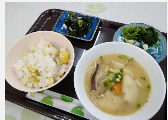
マルシェ開催時には、カフェスペースで岳間の食材を使った料理を提供。