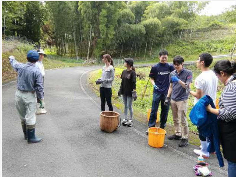
↑ 熊本県立大学との連携によって実施された農業インターンシップ。

平成30年にインターンシップで来た大学生たちは、同年9月、3班に分かれて作業活動の発表会を行った。また、農業インターンシップの取り組みは、新聞で紹介された。