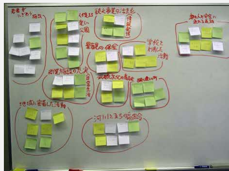
↑ KJ法による課題・意見の集約、整理。