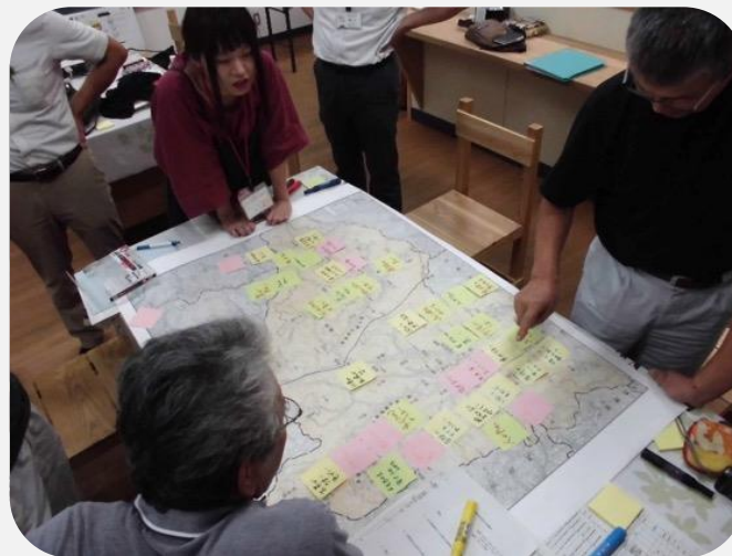
← 3度のワークショップで地域課題を出し合った。