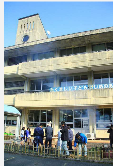
→ ワークショップはすべて旧岳間小学校「ほっと岳間」のかつての教室で行われた。