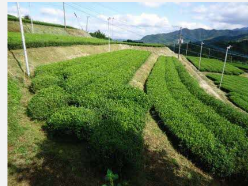
← 基盤整備前の茶園。

作業の効率化・機械化を前提とした茶園の再配置を行った。傾斜地茶園の列を奇数から偶数にする(区画を広げる・傾斜をならす)ことで、茶摘み機の効率を上げることができる。平成30年に1箇所、令和元年に1箇所の施工を実施。平成30年に区画整備をした茶園はすでに茶を植えている。収穫は3年先となる。