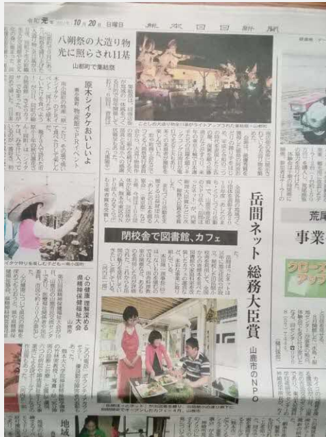
← 岳間ほっとネットの総務大臣賞受賞を報じた熊日記事。(令和元年10月20日付熊本日日新聞朝刊)

◎NPO法人『岳間ほっとネット』の活動は、平成30年度『熊本県農業コンクール・地域農力部門』で、優良賞(特別賞)を受賞。また令和元年度『あしたのまち・くらしづくり活動賞』で総務大臣賞を受賞した。