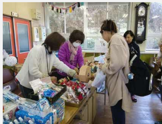
「マママルシェ」。情報発信やテストマーケティングの場として期待されているが、地元の人々との融和やコミュニケーション活性化が課題。

◎年4回、『ほっと岳間』にて『マママルシェ』と題したマルシェ(市場)を開催。『マママルシェ』は山鹿の子育て世代の女性たちが中心となって活動している。山鹿の子育て世代とは、岳間の子育て支援センターの職員を介してつながり、活動の場として『ほっと岳間』を貸すようになった。『マママルシェ』では、1ブースで岳間の特産品を販売している。また、カフェスペースを利用し、料理の提供をしている。マルシェは1回につき400～500人の来場がある。