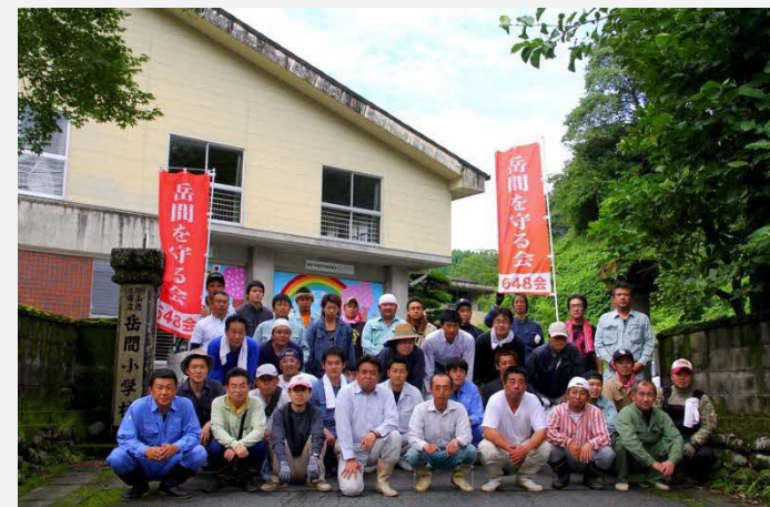
648会。岳間のシンボル『西岳』の標高にちなんでネーミングされた。