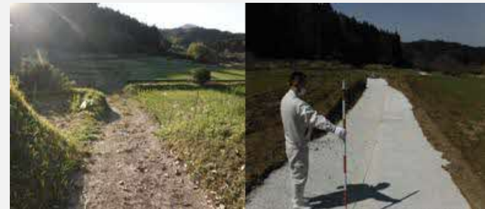
↑ 作業路整備(左整備前、右整備)