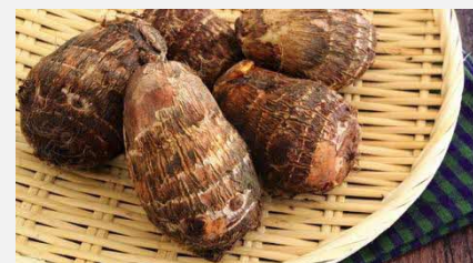
(上から)かぼちゃ(くりゆたか)、 にがごり(左)、深ネギ(右)、 里芋