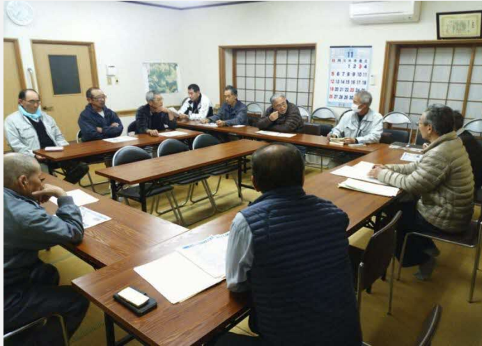
耕作道路・用水路整備に関する地権者協議