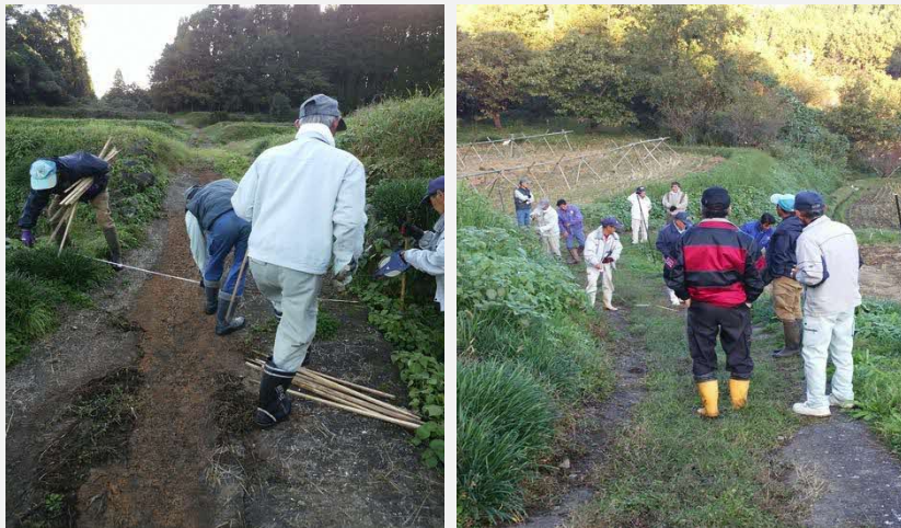
耕作道路・用水路整備に関する地権者現場確認