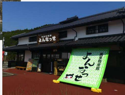
美里物産館よんなっせ