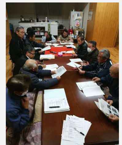
ビジョン案の策定会議(本部役員打ち合わせ)