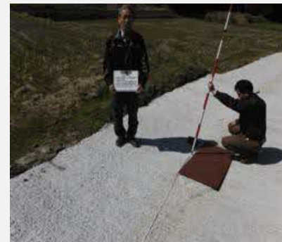
← 用水路整備の様子