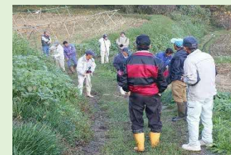
地権者による現場確認