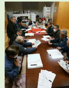
ビジョン案の策定会議