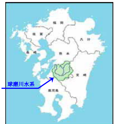
球磨川水系位置図

なお、流水の正常な機能を維持するため必要な流量には、水利流量が含まれているため、球磨川本川の水利使用等の変更に伴い、当該流量は増減するものである。また、今後、汽水域における生態系等について、さらに調査・検討を行い、河口部のノリ養殖等との関係について知見が得られた場合には、必要に応じ変更するものとする。