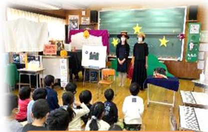
【ハロウィンお話会】