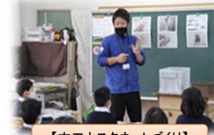
【木工カスタネットづくり】

子供たちに豊かな体験の提供をとおして、 放課後子供教室と放課後児童クラブの一体的な取組の推進、子供たちの豊かな人間性の育成 を図っています！