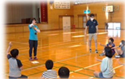
【頭と体をつかったゲーム】