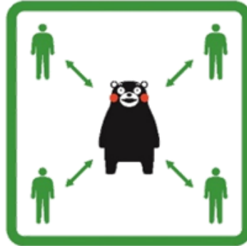
くっつかないモン #KeepDistance