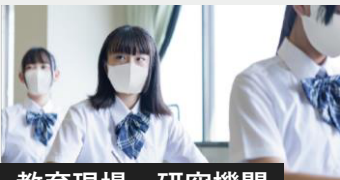
教育現場・研究機関

お客様訪問がある接客クルーやどうしても出社せざるを得ない職場でも、安心して働けることを目指します。