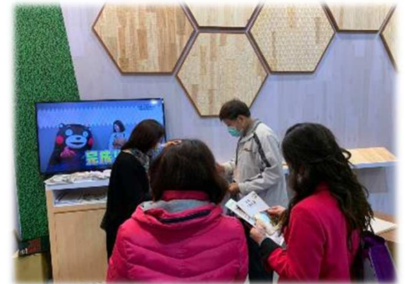
台湾台北市で開催された台北ビルディングショーにおける県産材PR

製材品は、アメリカ向け(戸建て住宅フェンス用等)が本格化したことにより大幅に増加。