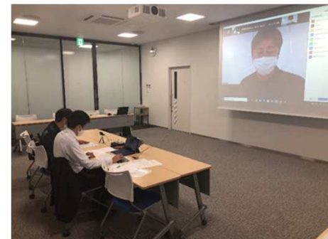
オンライン商談会(香港・熊本)

その結果、巣ごもり需要を捉えほとんどの品目で輸出が大幅に増加。特に、牛肉、牛乳などの畜産物やメロン、いちごなどの果物類の実績が顕著に増加。