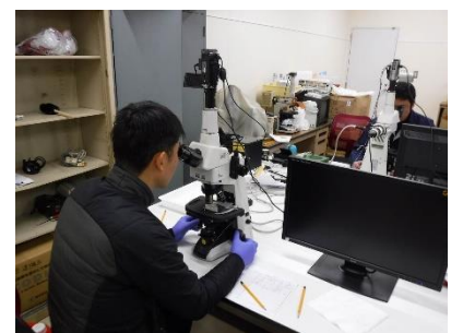
図9 ノリ葉体及び プランクトンの検鏡