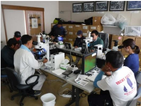
図2 芽付け検鏡巡回指導