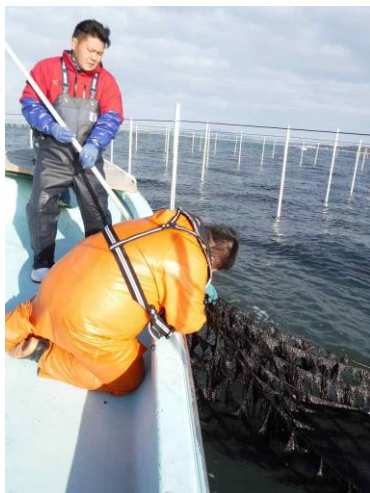
図4 ノリ葉体サンプル採取