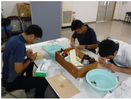
図1 カキ殻検鏡巡回指導