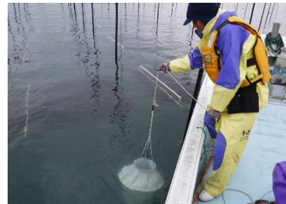
図5 プランクトン採集