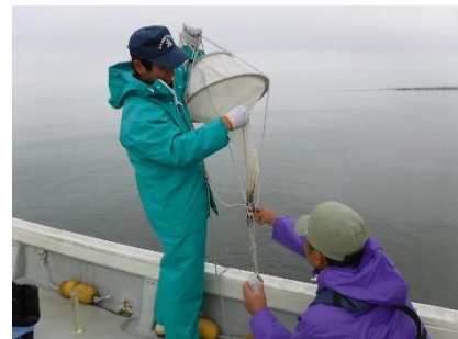
図6 プランクトン濃縮