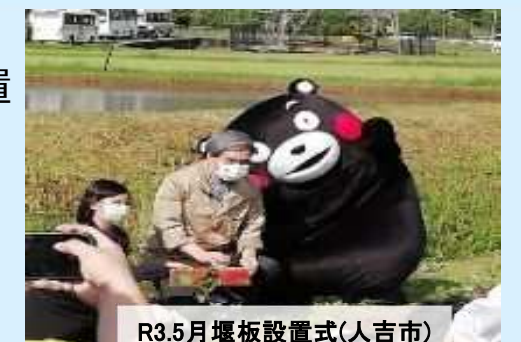
R3.5月堰板設置式(人吉市)

○人吉市鬼木地区（33ha）にモデル地区を設置し、実証・実験に取り組む中。 今後、市や土地改良区など関係機関と連携し取組面積を拡大予定。