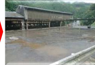
【被災したハーベスタ(水稻の脱穀機)の更新】