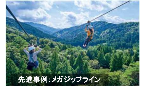
先進事例:メガジップライン