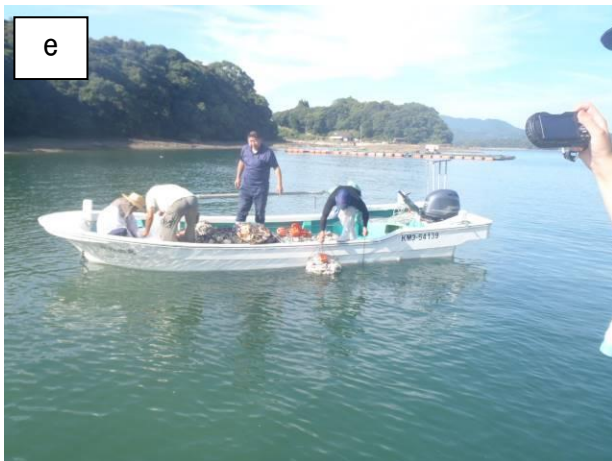
写真 ナマコ桁網組合によるナマコの種苗放流 a : 長崎県漁業公社から購入したナマコ種苗 b : 生残率向上を目的とした貝殻袋 c, d : 貝殻袋へのナマコ種苗の設置 e : ナマコ種苗を設置した貝殻袋による種苗放流