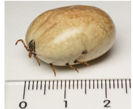
吸血後タカサゴキララマダニ