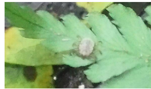
シダの葉で待ち伏せしているマダニ