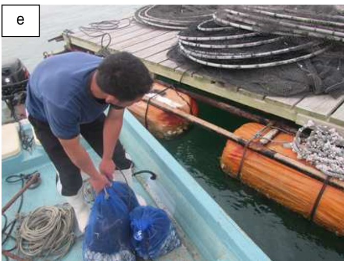
写真 ナマコ桁組合による稚ナマコ種苗生産施設の視察および稚ナマコ放流 a：佐賀県玄海水産振興センター職員による稚ナマコ生産概要の説明 b：稚ナマコ中間育成施設見学 c, d：稚ナマコ放流 e：有明地区での天然採苗試験のための採苗器設置