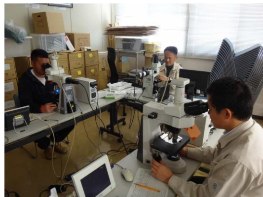
写真5 ノリ葉体の検鏡