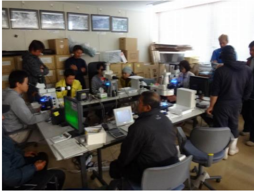
写真1 芽付け検鏡巡回指導