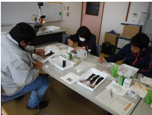
写真4 ノリ葉体サンプル処理（染色等）