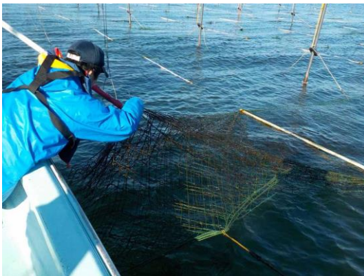
写真2 ノリ葉体サンプル採取