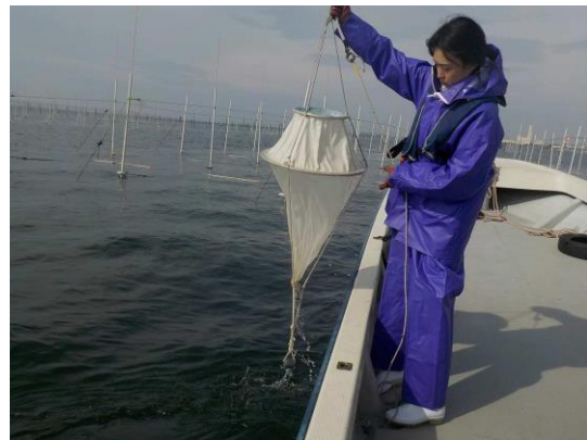
写真3 プランクトン調査