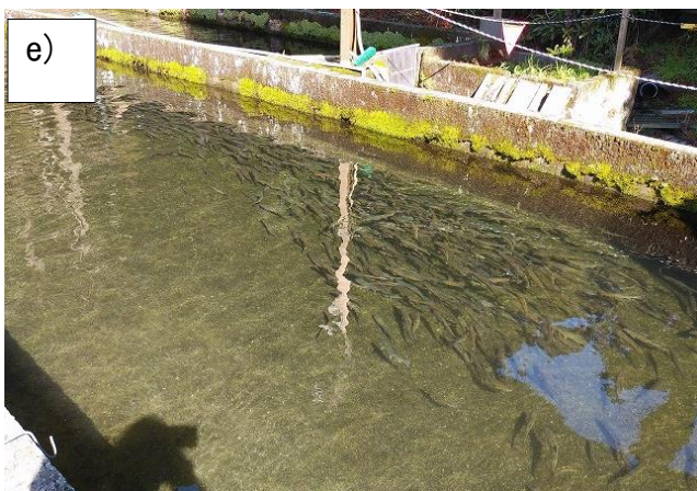
(a) 経営者への聞き取り (b) 薬品保管庫の確認 (c) 医薬品の使用および在庫状況の確認 (d~e) 飼育魚の確認