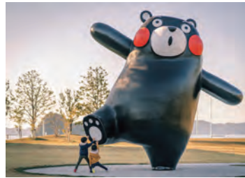
くまモンポート八代 @saw.c