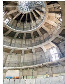
三角港フェリーターミナル @hirosakimisa_jewelrtrunk