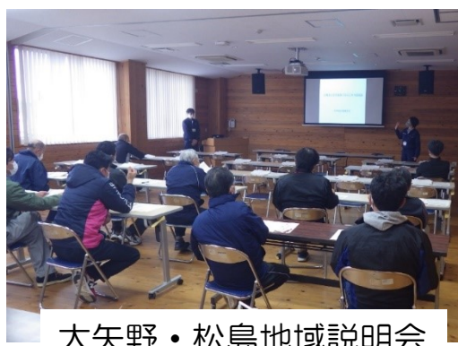
大矢野・松島地域説明会