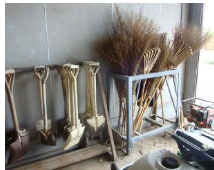
掃除用具はきのこと離して整理

現地確認 : 整理整頓の様子、清掃用品保管の状態 掲示物確認 : 清掃方法マニュアル