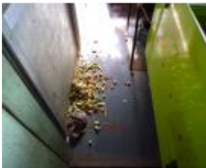
整理・整頓 (残さの片付け)