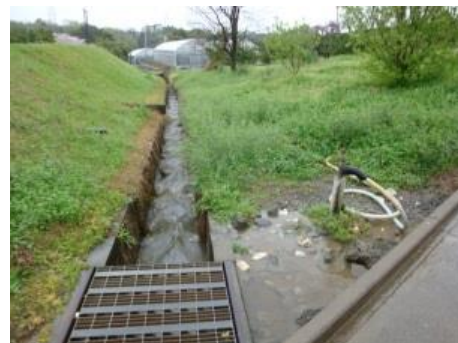
農薬や洗浄した水は河川や排水路に直接流さない