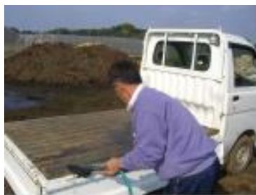
出荷用車両の荷台 はきれいに