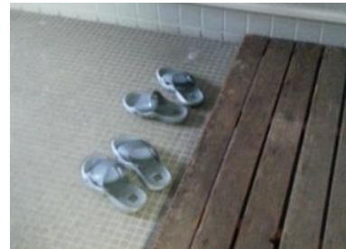
トイレ専用の履物