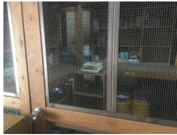
鍵のついた 農薬保管庫