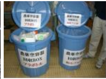
廃棄物等は分けて管理