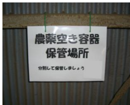
農薬空容器の適切な保管