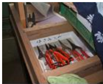
刃物（ハサミなど） はきちんと管理。