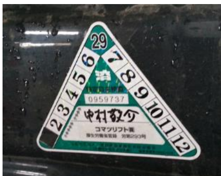
自主検査票の確認