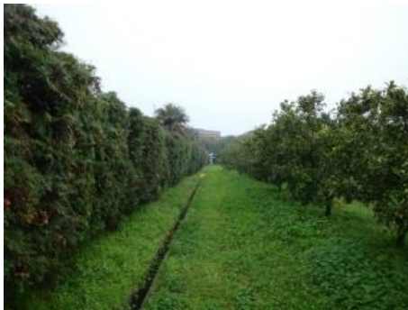
障壁作物の作付け