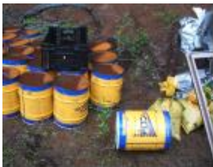
放置された農薬空容器（×）