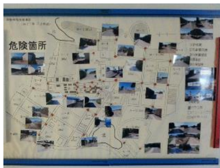
危険箇所の見取図