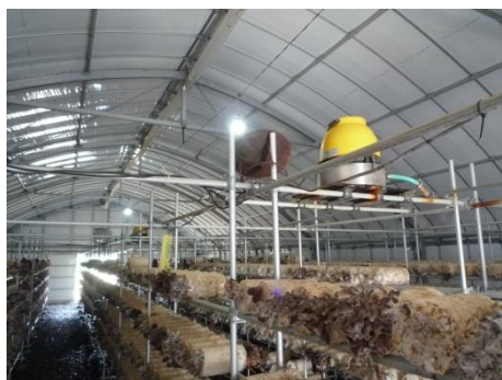
散水の水の水源の確認