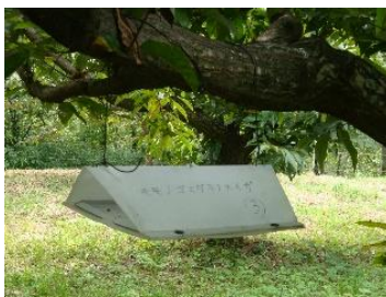
性フェロモン剤の設置

病害虫の発生予察情報等に基づき、耕種的防除（伝染病植物除去や輪作等）、生物的防除（天敵やフェロモン等の利用）、化学的防除（農薬散布等）、物理的防除（粘着版や太陽熱利用消毒等）を組み合わせた防除を総合的に実施し、病害虫の発生を抑制、管理する手法。