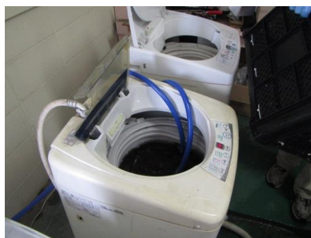
洗浄に使用する水の確認

書類確認：【参考様式③ きのこと生産施設等リスク評価表】 水質検査結果（必要な場合）