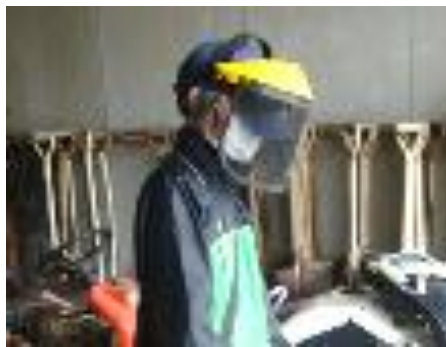
草刈用防災面の着用