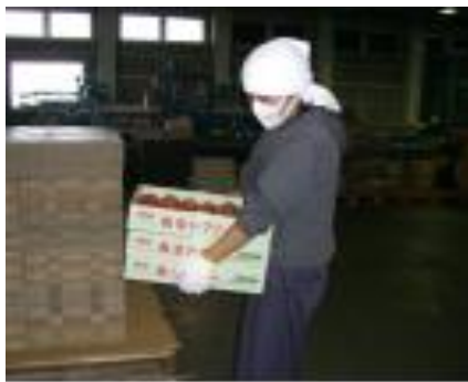
清潔な手袋を使用

きのこに直接接触れる作業者は、汚染の要因の一つとなりやすいため、作業者の衛生管理や健康管理を行います。