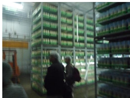
高所への菌床積載作業