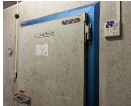
予冷庫の温度は定期的に確認