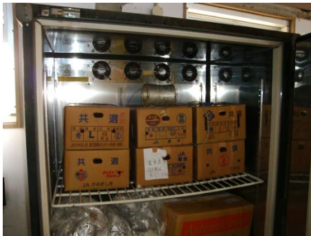
予冷庫に入庫して鮮度保持