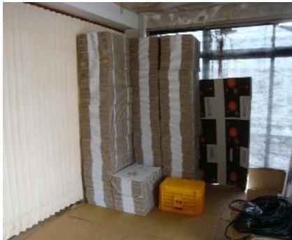
出荷資材は衛生的に保管

きのこが包装資材を通じて汚染されないよう、包装容器や出荷資材を衛生的に保管し、清潔な状態で使用するようにします。