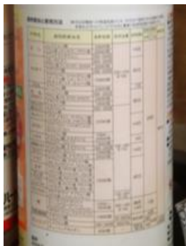
農薬ラベルでの確認