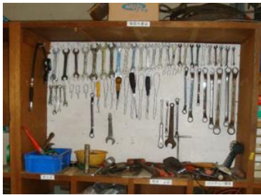
器具類を衛生的に管理