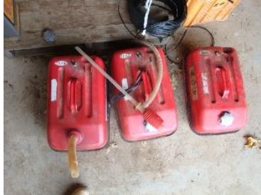
ガソリンは金属製の容器に入れる