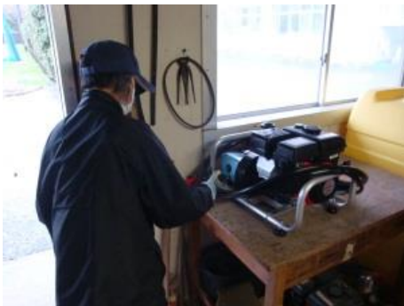
ノズルやホースの点検