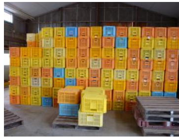
出荷コンテナを 衛生的に管理