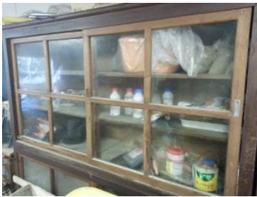
ガラス戸の棚に保管 しない (×) 【盗難の恐れあり】