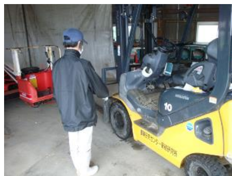
使用前点検の実施