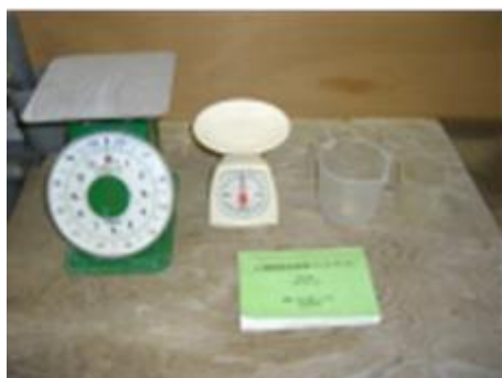
計量はかりや容器

環境保全のため、農薬の散布液が余ることがないように、必要な量だけを計って散布液を調製します。（経営改善にもつながります。）