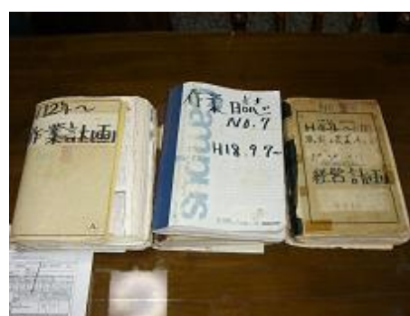
日々の生産記録を記帳