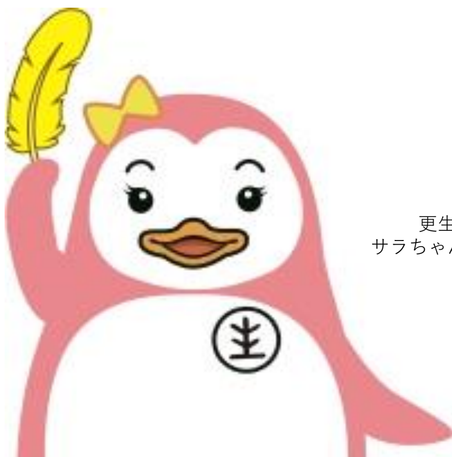
更生ペンギン サラちゃん・ホゴちゃん