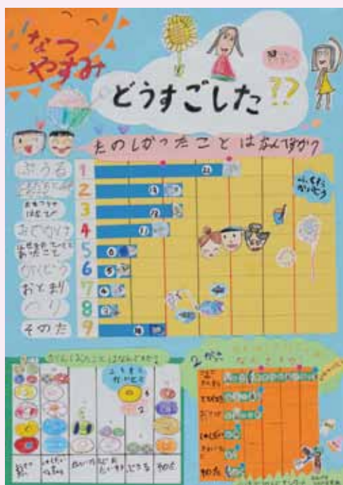
なつやすみ どうすごした??