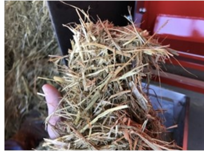
写真1 繁殖牛向け発酵TMR