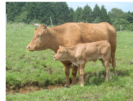
写真1 褐毛和種牛の親子

※1…養分要求量に合うように粗飼料、濃厚飼料、ミネラル、ビタミンなどをすべて混合した飼料のこと。 ※2…TDN(飼料中の消化、吸収される養分総量のこと。飼料の栄養価の指標となる。)ベースの数値。