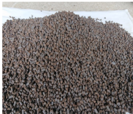
写真1 牛ふんペレット堆肥