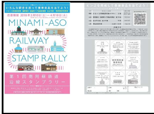
(写真10) 第1回南阿蘇鉄道沿線スタンプラリー：南阿蘇村主催