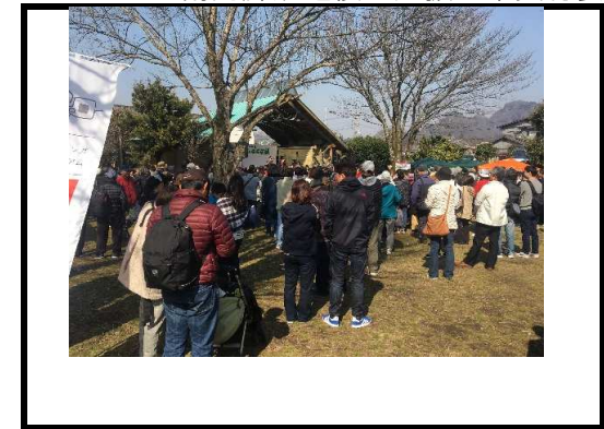
(写真12) 南阿蘇鉄道復活祭5thSTAGE ステージイベント