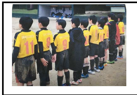
(写真17) つながろう南阿蘇鉄道PR支援事業 高SPO. FC：各種サッカー試合着用