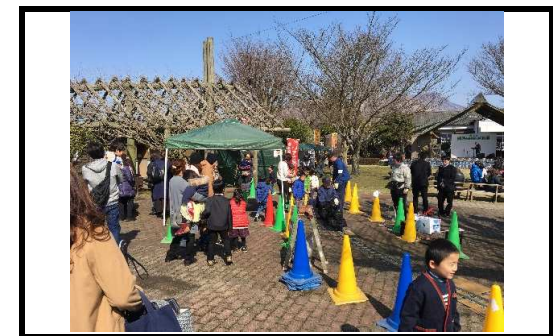
(写真15) 南阿蘇鉄道復活祭5thSTAGE 会場風景