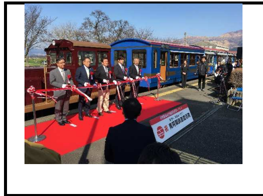
(写真11) 南阿蘇鉄道復活祭5thSTAGE テープカット（高森駅）