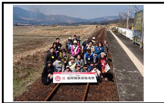
(写真13) 南阿蘇鉄道復活祭5thSTAGE レールウォーク