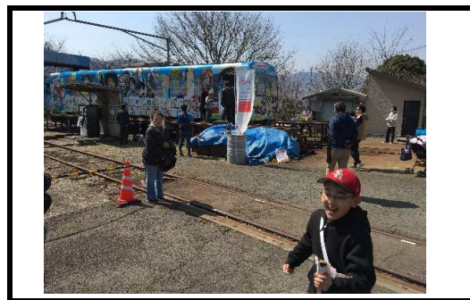
(写真14) 南阿蘇鉄道復活祭5thSTAGE 出張合志マンガミュージアム