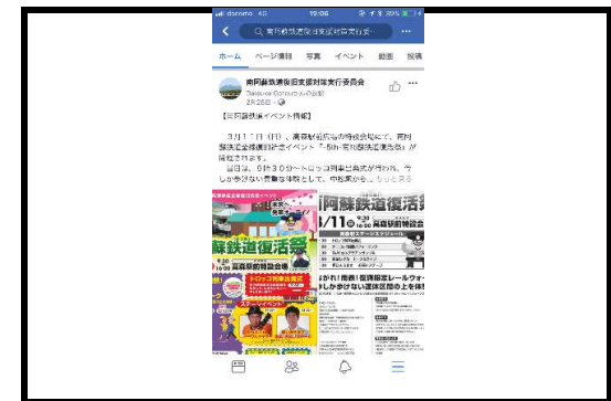
(写真18) フェイスブックによる情報発信