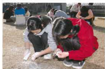
「石を削るのって面白い」「どんな形にしようかな」

緑豊かな丘陵に建つ県立装飾古墳館は、装飾古墳をテーマにした全国でも珍しい博物館だ。建物も前方後円墳をイメージしており、周辺の自然や古墳群に違和感なく溶け込んでいる。展示室などがある館内へは、屋上から続くらせん状のスロープを下って入っていく。一度階段を上がり周囲の古墳のある風景を眺めながら、建物にぐるりと巡らされたスロープを降りていく間に、次第に古代の世界へと導かれていく、そんな感覚である。