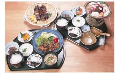
イノシシ肉の串焼き(写真左上)や竜田揚げのセット(写真左下)、シシ鍋のセットなど、泉の食文化が発信される