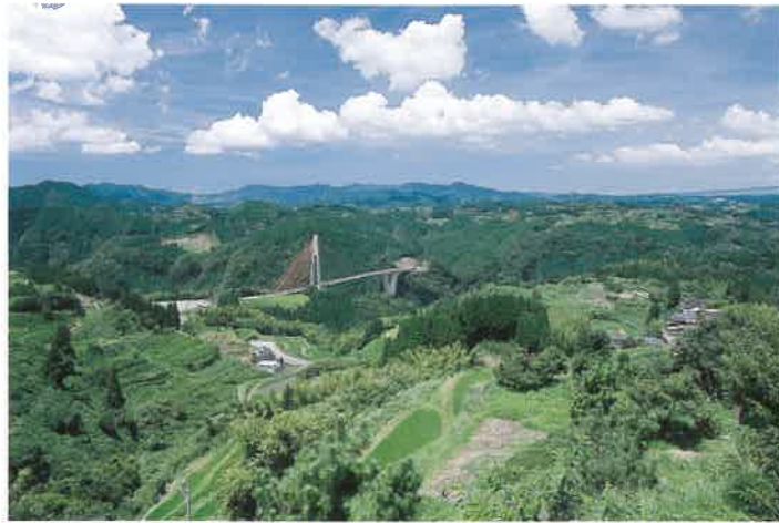
緑川の深い渓谷に架かる「鮎の瀬大橋」。自然の中のアクセントになっている