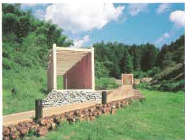
鹿北町アート・プロジェクト

熊本郡鹿北町の「鹿北町アート・プロジェクト」は2001年度グッドデザイン賞(建築環境デザイン部門)と第17回都市公園コンクール審査委員会特別賞を受賞。宇土郡不知火町の「不知火文化プラザ」は、建築、サービス面に優