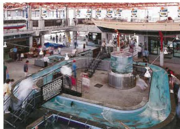
連日多くの人で賑わう、物産館「うしぶか海彩館」。新鮮な魚介類などが人気だ