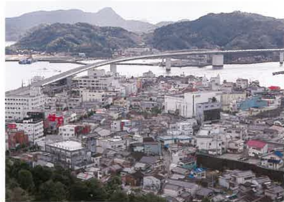
景観形成地域の一部。牛深市役所も外壁の色を塗り替えた

優れた景観は一朝一夕に出来るものではない。長い時間をかけ、景観という名の「文化」を醸成する試みが、アートポリスをきっかけに今、始まった。