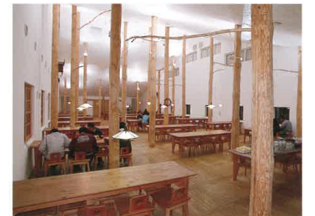
木立の中の教会をイメージしたという木の香あふれる食堂。

交流スペースに集う学生が少ないからといって、学生間の交流がない、と心配するのは早計だ。「交流スペースは寮で生まれたカップルに譲って、同性で集まる時には狭くても誰かの部屋におしかける」という学生たち。「寮でできた友だちは、きょうだいのような(一生続く)仲間」と互いを認めあっている。木の学生寮では、共に学び、共に暮らす若者たちのやさしい友情が穏やかに育まれているのだ。