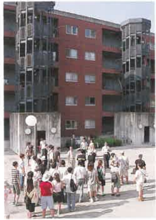
熊本市宮新地団地で説明を熱心に聴く韓国の学生たち

質の高い建築文化を発信する「くまもとアートポリス」には、毎年国内外から多くの視察者が訪れている。平成13年8月23・24日には、韓国光州廣域市湖南大学から建築系学生41人が来熊。熊本市宮新地団地や県立美術館分館、熊本北警察署などを見学した。