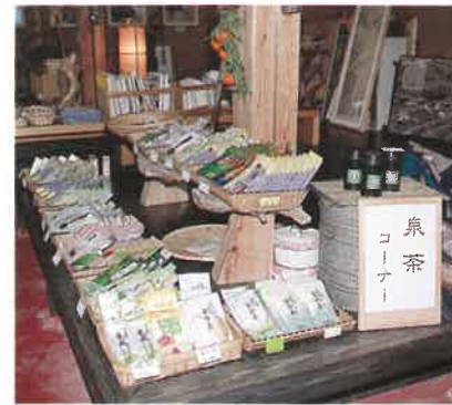
泉村の気候風土が美味しいお茶を育む。販売コーナーには15メーカー以上のお茶が並び