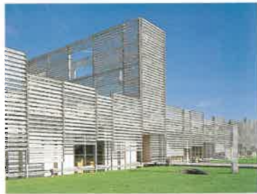
不知火文化プラザ

熊本郡鹿北町の「鹿北町アート・プロジェクト」は2001年度グッドデザイン賞(建築環境デザイン部門)と第17回都市公園コンクール審査委員会特別賞を受賞。宇土郡不知火町の「不知火文化プラザ」は、建築、サービス面に優