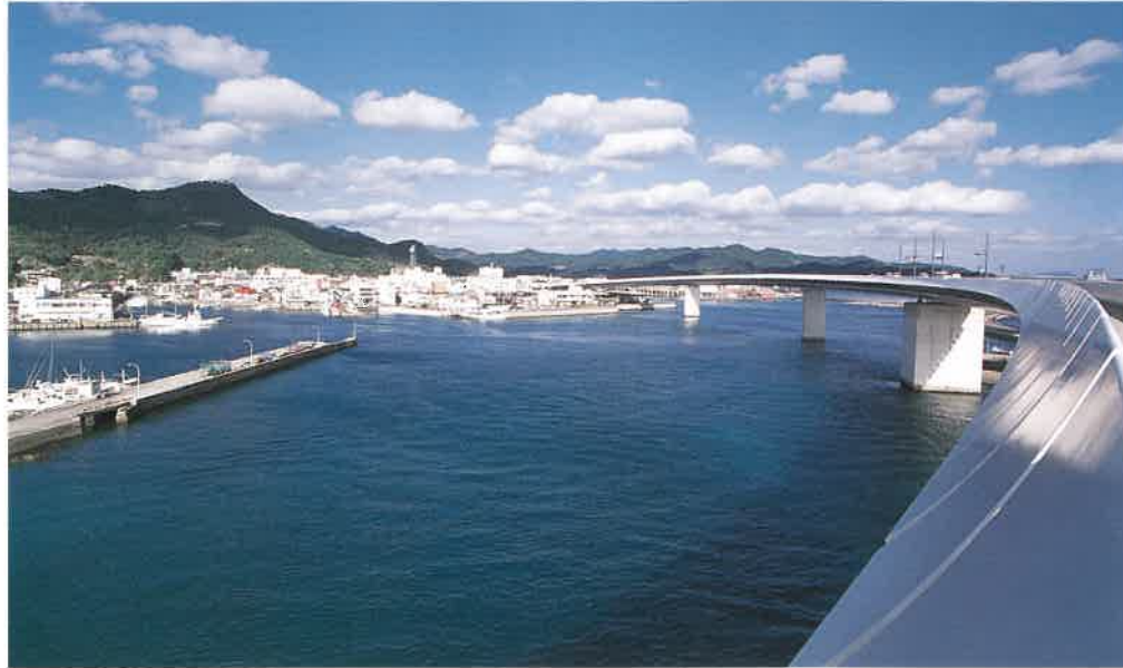
銀の帯のような牛深ハイヤ大橋が、牛深港の景観を一層美しくする