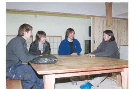
卒業後はそれぞれの地元に戻る若者たち。寮での共同生活は、貴重な人生経験だ