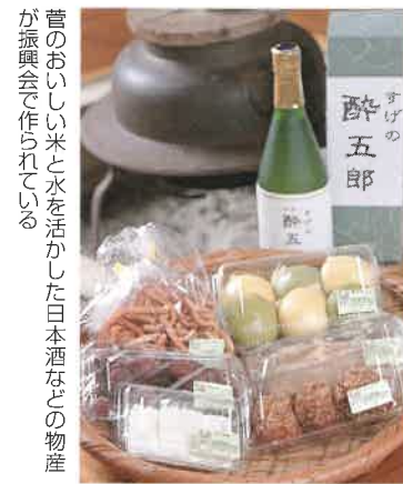
昔のおいしい米と水を活かした日本酒などの物産が振興会で作られている

「陸の孤島」と呼ばれた菅地区の生活は、「鮎の瀬大橋」ができて格段に便利になった。もともと「山里のやすらぎ