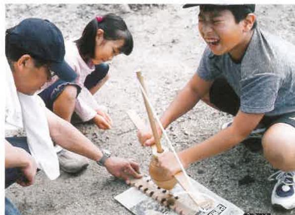
古代経験を楽しむ子どもたちの表情は、次第に生き生きとしてくる