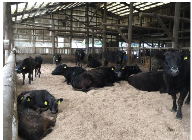
上写真：ふかふかベッドで、各々好きな場所で寝ている牛群、牛が横になれる環境づくりも大切です。