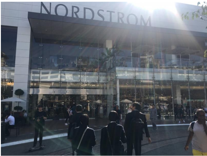
ノードストローム外観