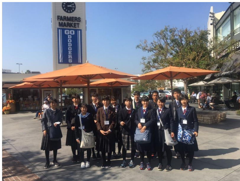
(奥に見えるのがファーマーズマーケット)