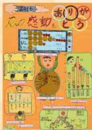
2016 Rio 感動をありがとう