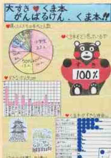
大すき♡くま本がんばるけん、くま本!!