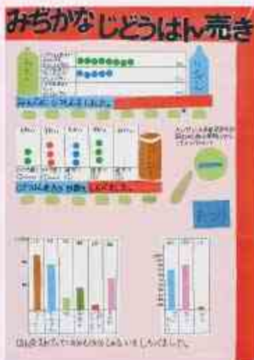
みちかなじどうはん売き