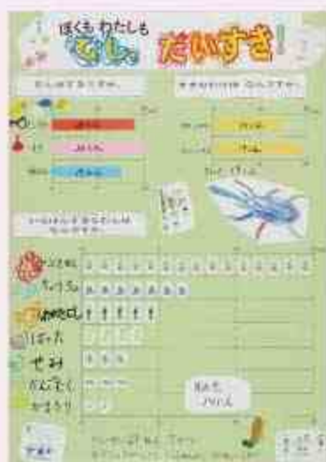
ぼくもわたしもむし、だいすき!