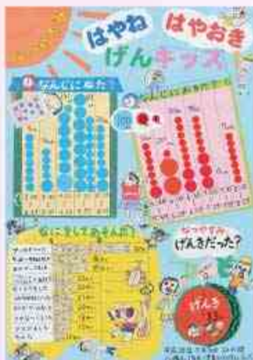
はやねはやおきげんキッズ！