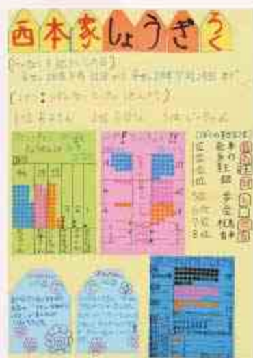
西本家しょうぎろく