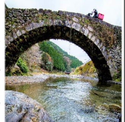
今も人々の生活を支える「笠松橋」

「めがね橋」の架設技術は、中国やオランダから九州の長崎に伝わった技術がこの地に伝わったとも、地域の石工たちが、自然が生み出した「白髪岳天然石橋」の見事なアーチの造形から着想を得て、架橋技術を編み出したともいわれています。そしてその技術は、多くの石工たちが生活した山間部の種山地域(現八代市東陽町)を中心に、八代各地で脈々と受け継がれてきました。