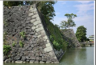
八代産石灰岩で築かれた「八代城の石垣」

八代の人々は、阿蘇山の噴火活動により堆積した「凝灰岩」や、良質な「石灰岩」の地層が点在する、この地の環境を活かし、古来より地域で採れる石材を活用したまちづくりを行ってきました。八代城の石垣・干拓樋門・石積みの棚田・めがね橋など、八代各地に現存するこれらの石造建築物の数々は、多くの名石工を輩出した「石工の郷」の風土が、この地で脈々と育まれてきたことを物語っています。