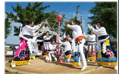
八代にもたらされた伝統芸能「女相撲」