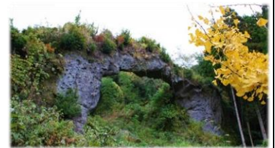
自然が生み出した「白髪岳天然石橋」

その名声は、各地の為政者の耳にも届き、薩摩藩に招かれ大型のめがね橋の架橋をおこなうなど、活躍の場を更に広げていくことになりました。