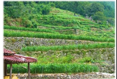
山肌を覆う見事な「石積みの棚田」