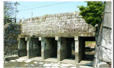
石工たちが築いた「大鞆樋門（穀樋）」

現在では、熊本県有数の農業地帯となっている緑豊かな八代平野も、以前は「お国一の貧地」と呼ばれるほど、平野部が狭く、農業には向かない湿地と干潟が広がる地域でした。そのため、この地では人々の暮らしを豊かにするために、江戸時代～昭和初期にかけて大規模な「干拓事業」が幾度となく行われ、現在の八代平野の実に約3分の2に及び土地が干拓によってもたらされました。この干拓事業には、膨大な数の人夫が動員され、石工たちも石材の切出し、運搬、加工の担い手として長期間にわたって携わりました。これにより、安定的に仕事を得ることになった石工たちは、さらに技に磨きをかけていき、活躍の幅を広げていきました。