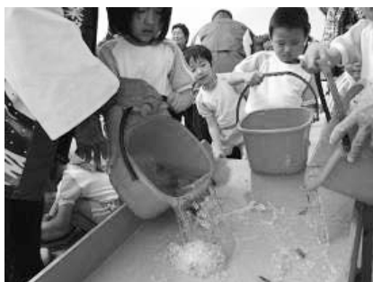
ヒラメの放流風景