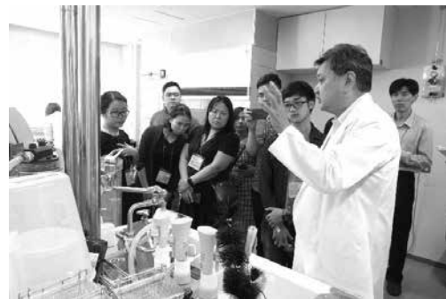
さくらサイエンスプラン水俣研修 (国立水俣病総合研究センターにおける水銀分析技術研修) 〈水俣環境アカデミア活動推進事業〉