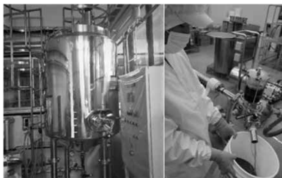
清澄果汁製造設備の導入