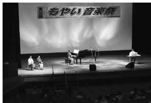
第12回もやい音楽祭