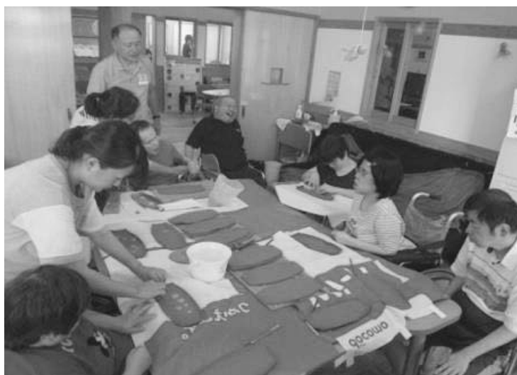
交流サロンでの創作活動の様子 ＜胎児性・小児性水俣病患者等に係る地域生活支援事業＞