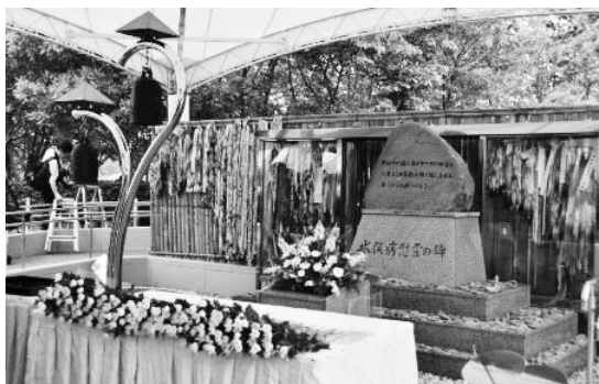
水俣病慰霊の碑 〈水俣病犠牲者慰霊式〉