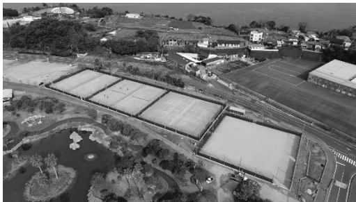
テニスコート 8 面 〈都市公園事業〉

土地・施設を有効活用することで地域の活性化と雇用の増大に繋げるため熊本県と芦北町で連携し、業種に拘らず、誘致を積極的に進める。