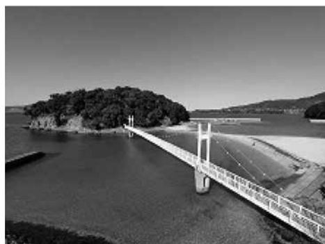
湯の児海水浴場 <魅力ある湯の児温泉づくり事業>