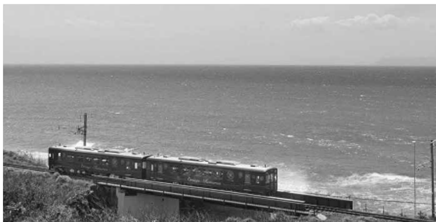
肥薩おれんじ鉄道 観光列車「おれんじ食堂」