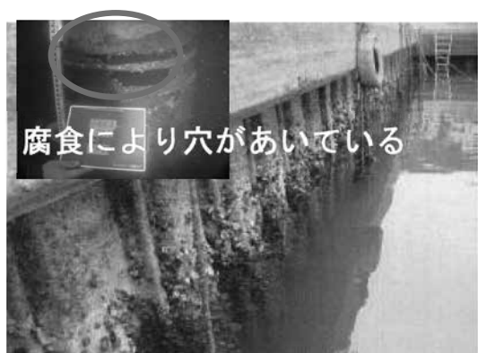
機能保全工事の実施 【着工前】

漁船、うたせ船、貨物船が混在して航行していた佐敷港の船舶航行の安全性の向上のため、平成 27 年度（2015 年度）に女島地区へ機能移転させた後の計石地区の有効活用について、芦北町等と協議を進める。