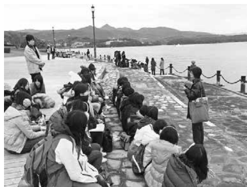
エコパーク水俣での環境学習 〈水俣・芦北地域環境フィールドミュージアム事業〉