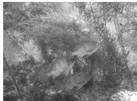
アカモクとメバル