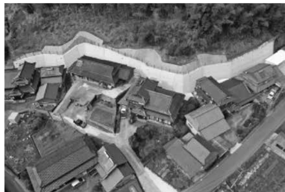
急傾斜地崩壊対策事業