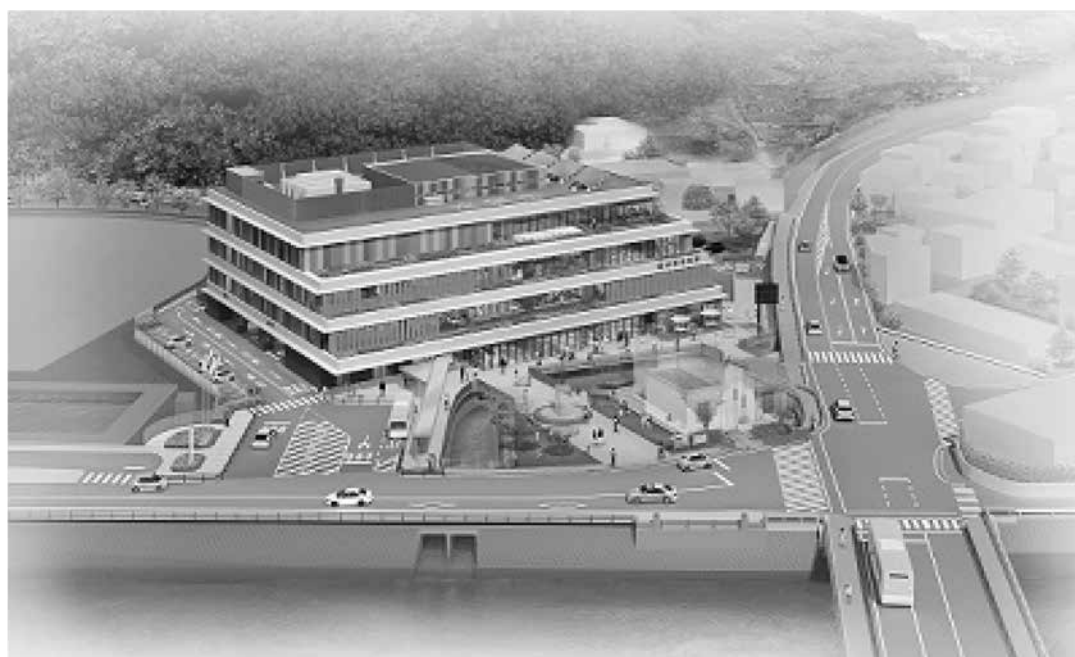
水俣市役所新庁舎完成イメージ図 ＜水俣市役所新庁舎建設事業＞