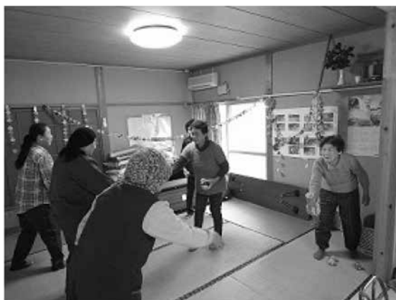
楽しみながら体を動かすお年寄りたち（芦北町うぐいす地区）