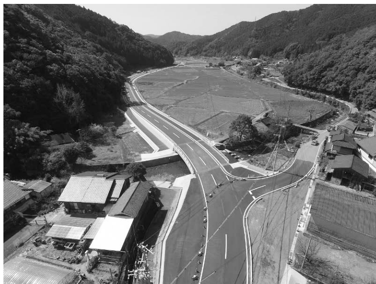
主要地方道：芦北坂本線（宮浦工区） <道路改良事業>