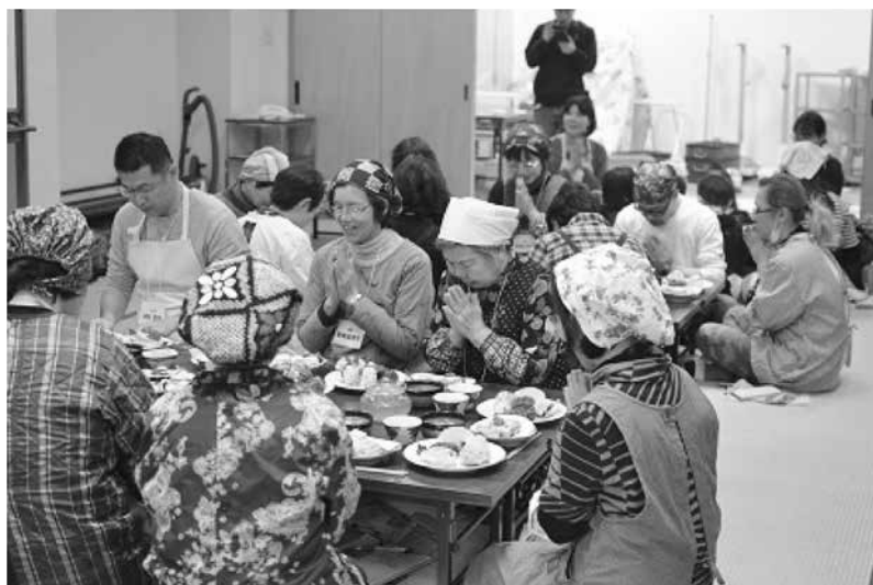
郷土料理教室（津奈木町）