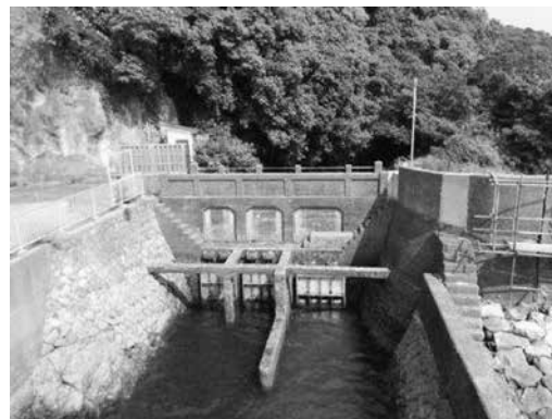
老朽化した樋門の状況 ＜海岸堤防等老朽化対策緊急事業＞