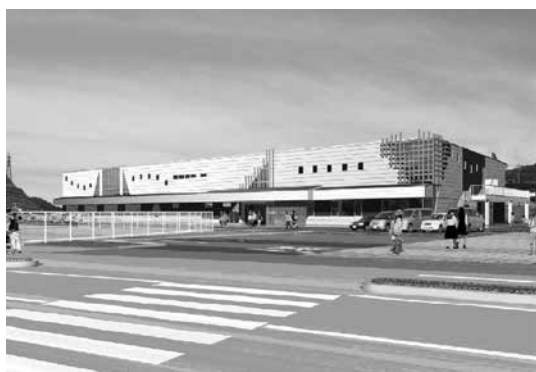
芦北町総合コミュニティセンター（完成予想図） <芦北町総合コミュニティセンター管理運営事業>