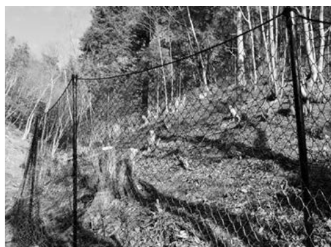
鳥獣被害防止柵 <鳥獣被害防止対策>