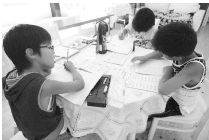
西方寺古城クラブ（水俣市 中央保育園学童クラブ） <放課後児童クラブ施設整備事業>