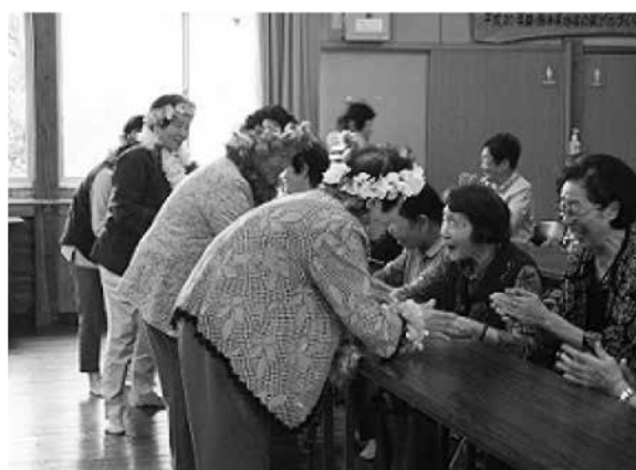
うれしそうに歌うお年寄りたち（芦北町計石地区）