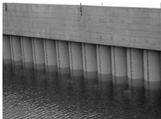
機能保全工事の実施 【竣工】