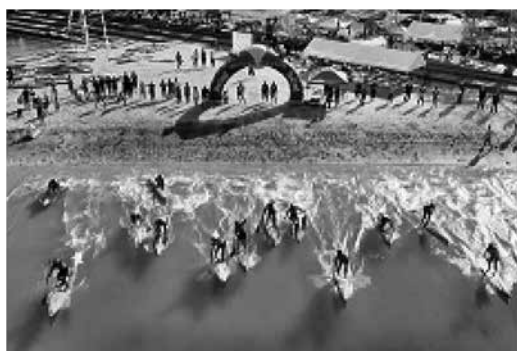
マリンアクティビティイベントの開催 <海の魅力発信事業>

津奈木町の主要施設が集積するつなぎ温泉四季彩周辺の魅力アップを図るため、基本構想及び実施設計に基づいて、宿泊施設などのハード整備を実施する。