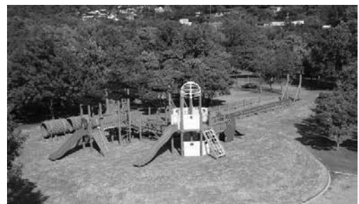
大型遊具 〈熊本県公園施設長寿命化対策支援事業〉