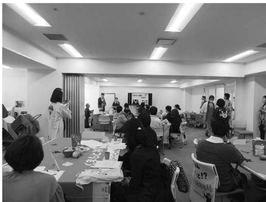
移住相談会 <移住定住の促進>