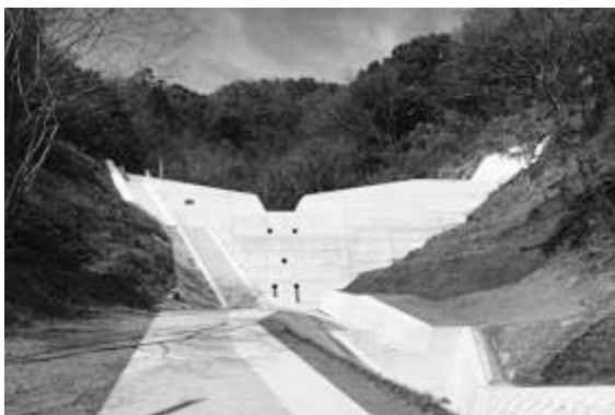
砂防事業 ＜砂防・急傾斜地崩壊対策・地すべり対策・統合流域防災＞