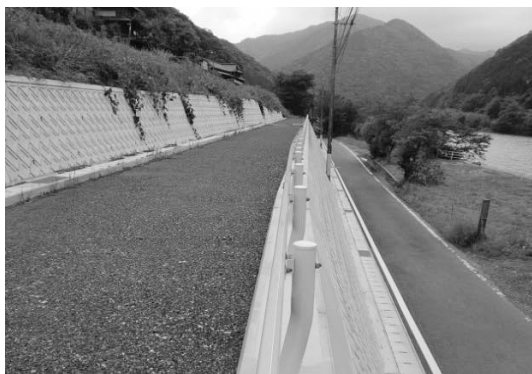
冠水対策事業イメージ ＜道路防災対策事業＞