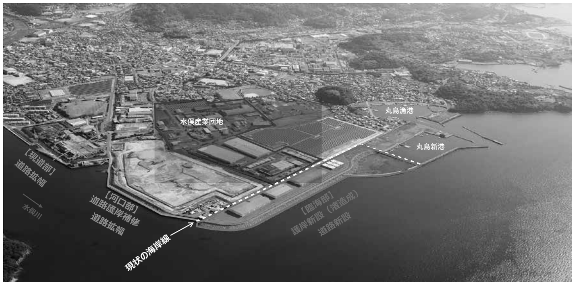
水俣川河口臨海部振興構想イメージパース 〈水俣川河口臨海部振興構想の推進〉