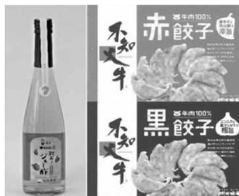
新商品の開発支援