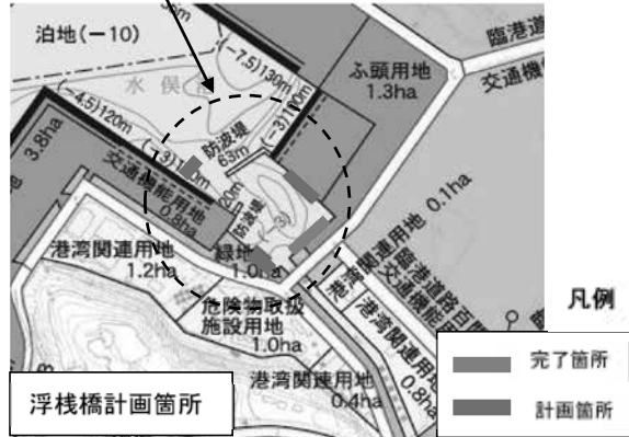
<水俣港社会資本整備交付金事業(水俣港港湾整備事業)>