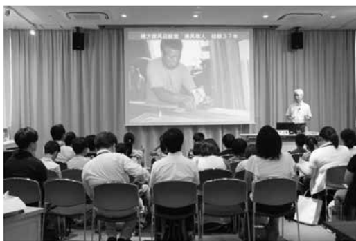
語り部講話 〈次世代へつなげる水俣病資料館ルネッサンス事業〉