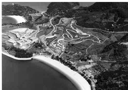
芦北海浜総合公園 <芦北海浜総合公園施設長寿命化事業>