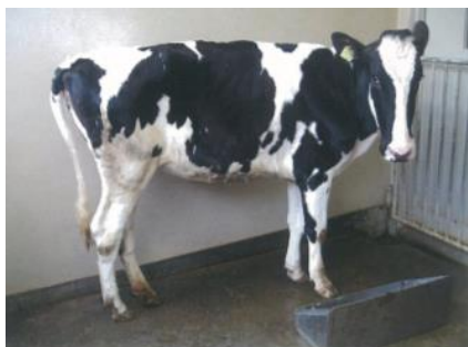
PI牛（削瘦、ウマズラの顔貌）

牛ウイルス性下痢は全国的に発生件数が増加傾向にあります。本県でも令和2年（2020年）7月22日時点で、26戸で422頭を検査しており、このうち3戸で4頭のPI牛（疑い含む）が摘発されています。農場にBVDVを侵入させないことに加え、農場内でBVDV感染を拡大させないためには以下の対策が重要です。