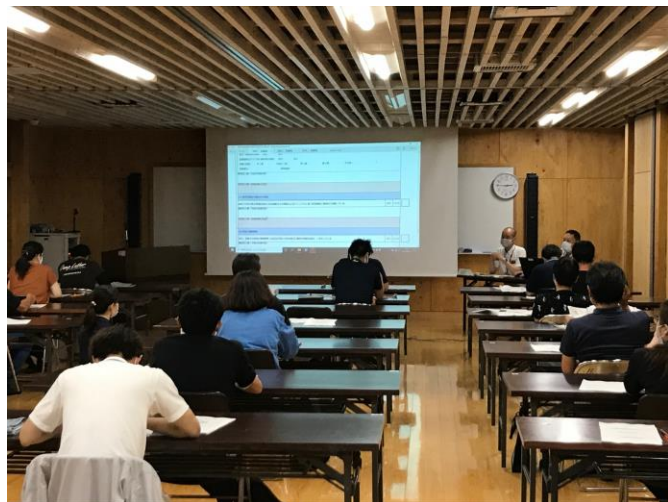
6月30日の会議の様子

悪性家畜伝染病が侵入した際には、発生農場だけでなく、地域全体における封じ込めが必要となります。畜産農家の皆様におかれましては、日頃から飼養家畜の十分な健康観察を行うとともに、飼養衛生管理基準の自主的チェックと改善及び定期的な農場消毒をお願いします。