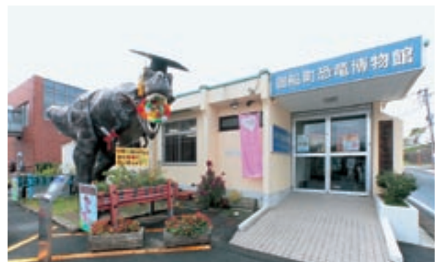
現在の恐竜博物館

地域住民や来館者がグローバルな視野で恐竜を楽しみ「恐竜」という共通の話題による感動を共有する場を設けることができました。海外の化石標本を用いた展示会は各地で開催されていますが、未処理の化石を借用し長期にわたって恐竜研究の現場を見せる展示は全国でも初の試みであり、新たな展示のモデルケースとなっています。ロッキー博物館と姉妹館提携を結び事業が継続発展していること、ブランドイメージの醸成が進んだことも取り組みの成果となりました。平成26年4月の新たな恐竜博物館のオープンを機にリピーターを始め多くの見学者が期待できます。