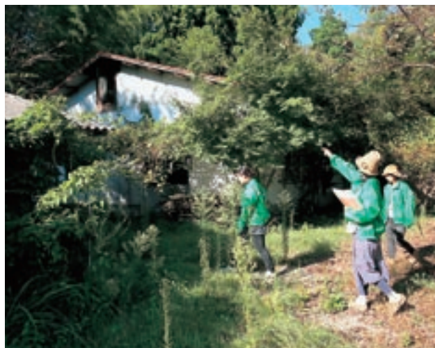
空き家調査の状況

また、移住者間の交流ネットワークも形成されており、各種イベントへの参加も活発に行われています。