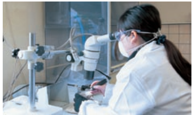
化石のクリーニング作業