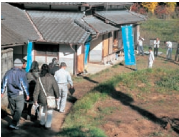
田舎暮らしモニターツアー（古民家見学）