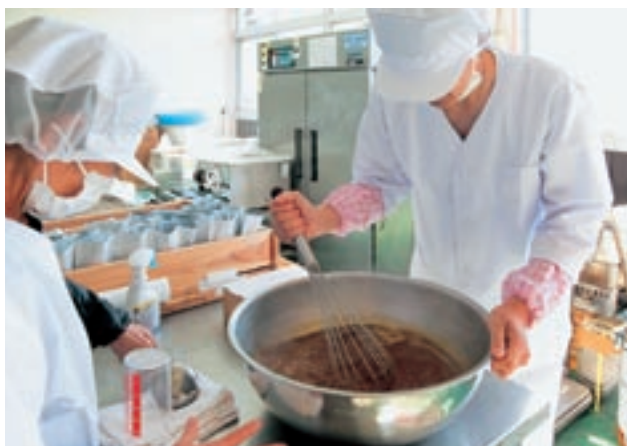
俵山カレーのルー作り

西原村の山間部地域では過疎化・高齢化が進んでおり、買い物ができる商店が近くにない状況にあります。現在、食料品は週に一度の移動販売に頼っており、日持ちのする缶詰やレトルト食品としてだけでなく、災害時の備蓄品としても、高齢者に好まれる保存性の高い食品の提供が望まれていました。