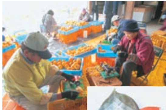
渋柿の皮むき作業

現在では、菓子製造業者等との取引も増えてきており、年間4万個の「ほっぺ」を製造しています。将来は年間10万個製造を目標に取り組んでいます。