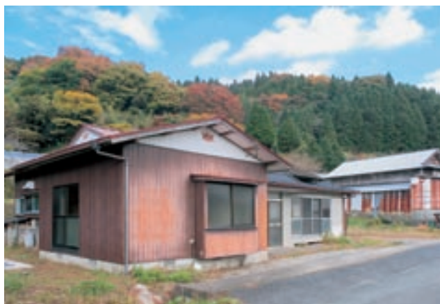
中山鹿集落の空き家住宅（畑付き）

「今後も村の基幹産業である農業の担い手を育て、産山村に定住していただけるよう取り組んでいきます」と語ってくれました。