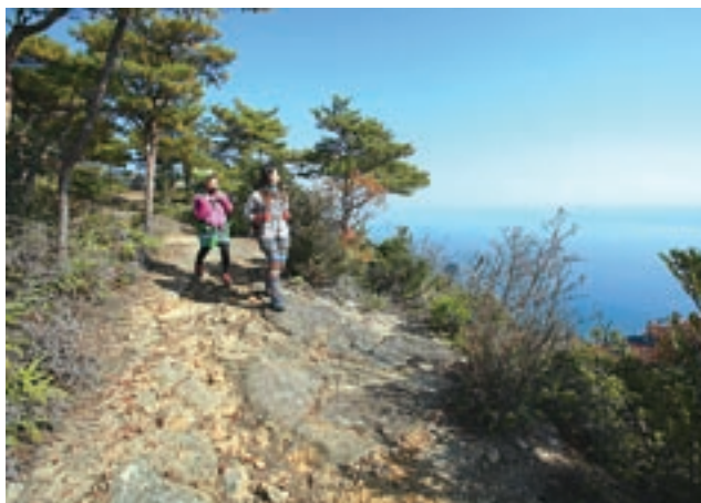
天草観海アルプスの風景

九州新幹線の全線開業や観光特急「A列車で行こう」の運行により、これまで減少傾向にあった上天草市の観光宿泊客数は増加に転じました。この効果を一過性のものとしないうちに、不知火海が一望できる天草観海アルプスを新たな観光資源として捉え、この地域資源を実際に体験してもらうため、女性のファッションに注目した取り組みを行いました。