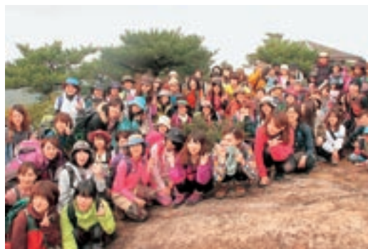
「山ガールサミット」トレッキングイベント