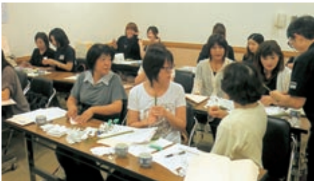
舞台セット 梨の花作り講習

そこで、市制施行70周年を機に、地域の良さや誇りを再認識することを目的に市民参加型の創作ステージを行うこととしました。