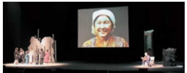
創作ステージ（母の記憶）