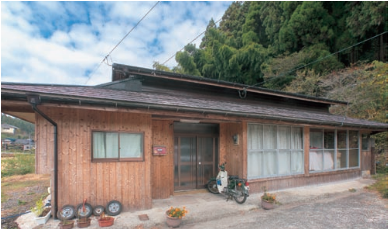
木目調の外観に改修された田尻集落の空き家住宅

村内の空き家を調査し、賃貸可能な物件を村が借り上げて改修し、村が求める移住希望者に提供する事業