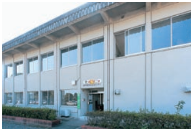
「町の台所あかり」が入る農業就業改善センターの外観

現在は、錦町内の3地区の高齢者宅（1地区当たり20世帯）に週1回（月・水・金）ずつ弁当の配達をされています。配達する日は、朝8時前からメンバーのうち3人が集まって弁当づくりを行い、お昼に間に合うよう配達されています。このほか、月に一度「いきいきサロン」3箇所にも温かい弁当の配達をされています。「弁当配達時に安否確認や健康状態の確認などの見守りもやっており、変わったことがあれば町健康保険課に連絡しています」「弁当配達以外にも「みそづくりの指導」を町の委託を受けてやっています」と話されているように、「町の台所あかり」の活動には町の信頼も厚いようです。