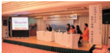
インバウンドフォーラム