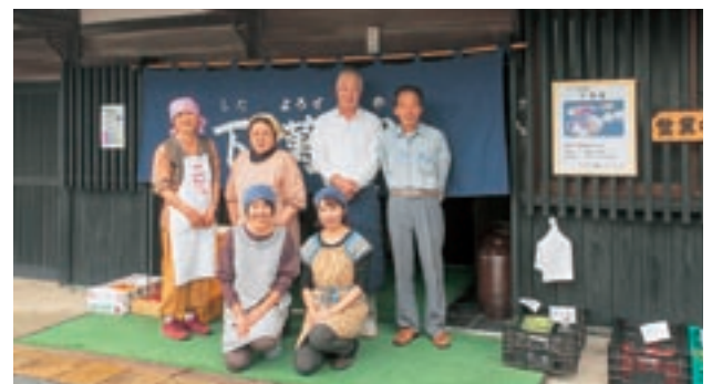
「下萬屋」のメンバー