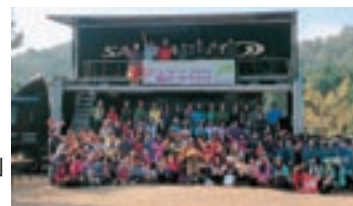
「山ガールサミット」 ステージイベント