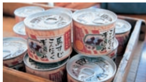
馬すじこんにゃく煮込みの缶詰

新たな販売ルート拡大としては、東京の「銀座熊本館」や西原村のアンテナショップ「はらじゅく畑」にも納品ができるようになりました。今後、東京都市圏の方が熊本の郷土料理をいつでも手に入れられるよう様々な商品を地域の方と一緒に開発していきます。