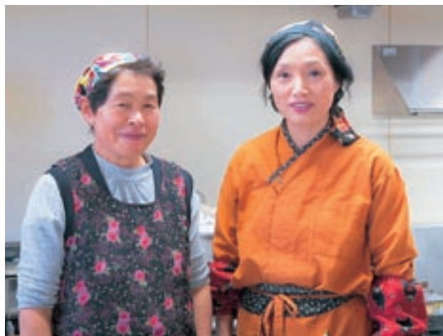
美里物産館「よんなっせ」のスタッフ