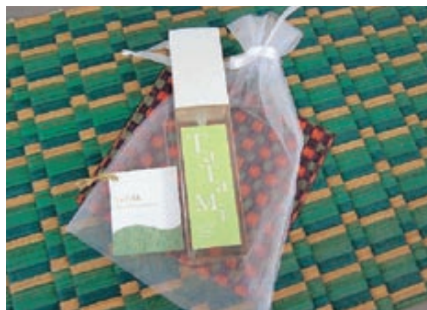
アロマウォーター・イ草サシェ（香り袋）