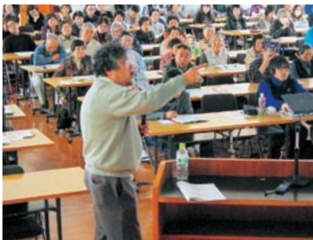
地域で生き抜くシンポジウム