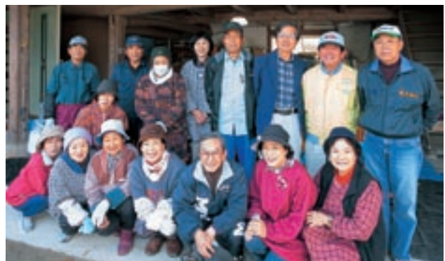
「菊鹿町干し柿研究会」のメンバー