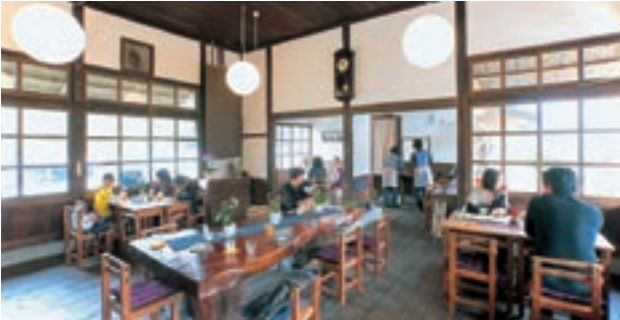
網田駅レトロ口館・駅カフェ

地元のまちづくり団体をはじめとする地域住民が地域活性化に向けた取り組みを行うことができる拠点として網田駅を再整備する事業