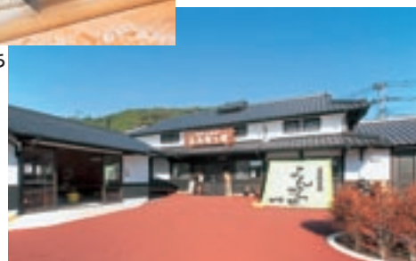
美里物産館「よんなっせ」