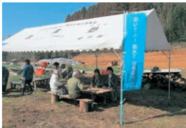
田舎暮らしモニターツアー（地域との交流）