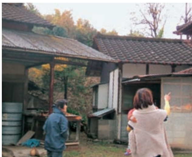
空き家調査の状況

しかし、まだまだ物件情報が不足しているなど認知度が不足していることから、活用可能な空き家の把握とその情報を活用した移住促進の取り組みを進める必要がありました。