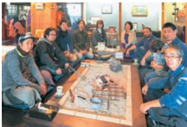
「NPO法人21世紀環境研究会」のメンバー