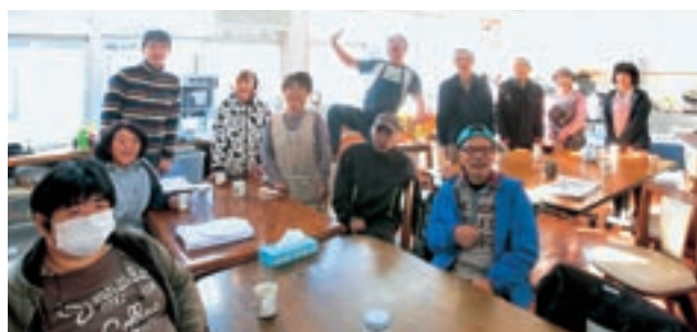
たんぼぼハウスのなかまたち