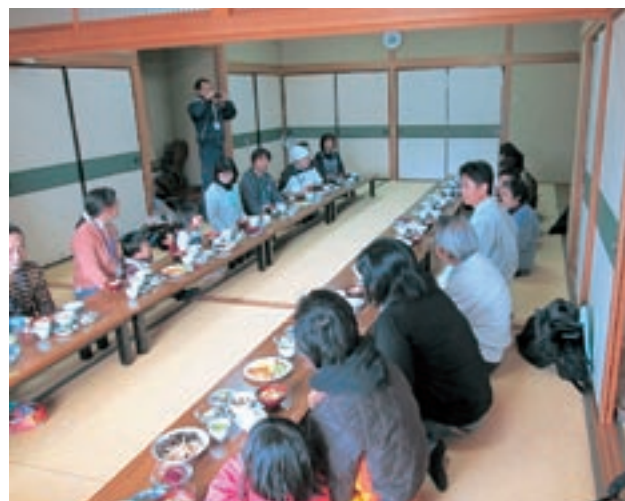
田舎暮らしモニターツアー（おふくろの味を堪能）

この取り組みにより、田舎暮らしを希望される方のニーズ、町内の空き家の現状、地域での移住者等の受け入れ状況等を把握することができました。また、以前から問題となっていた空き家対策として、空き家バンクを制度化することで、空き家の有効活用ができるようになり、移住・定住希望者の田舎暮らしの相談に円滑に対応が出来るようになりました。