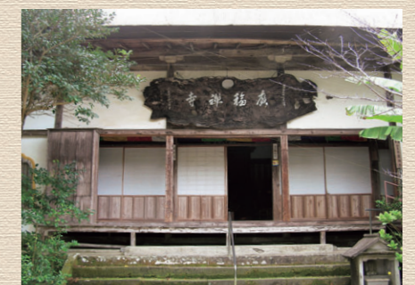
▲廣福寺 (玉名市石貫)