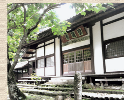
▲聖護寺 (菊池市鳳儀)