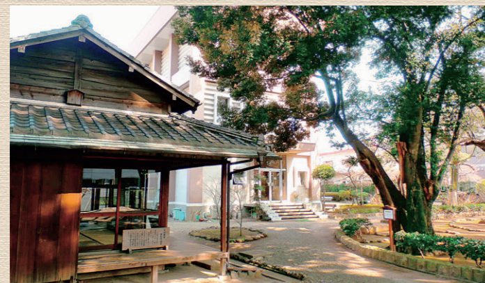
▲徳富記念園(熊本市)