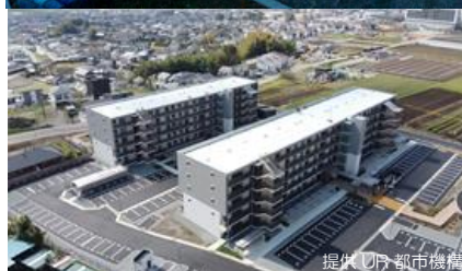
益城町馬水団地 外観