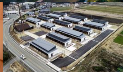
南阿蘇村下西原第1団地 外観