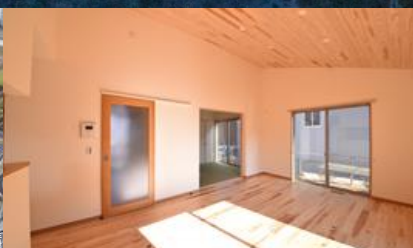
益城町砥川第2団地 内観