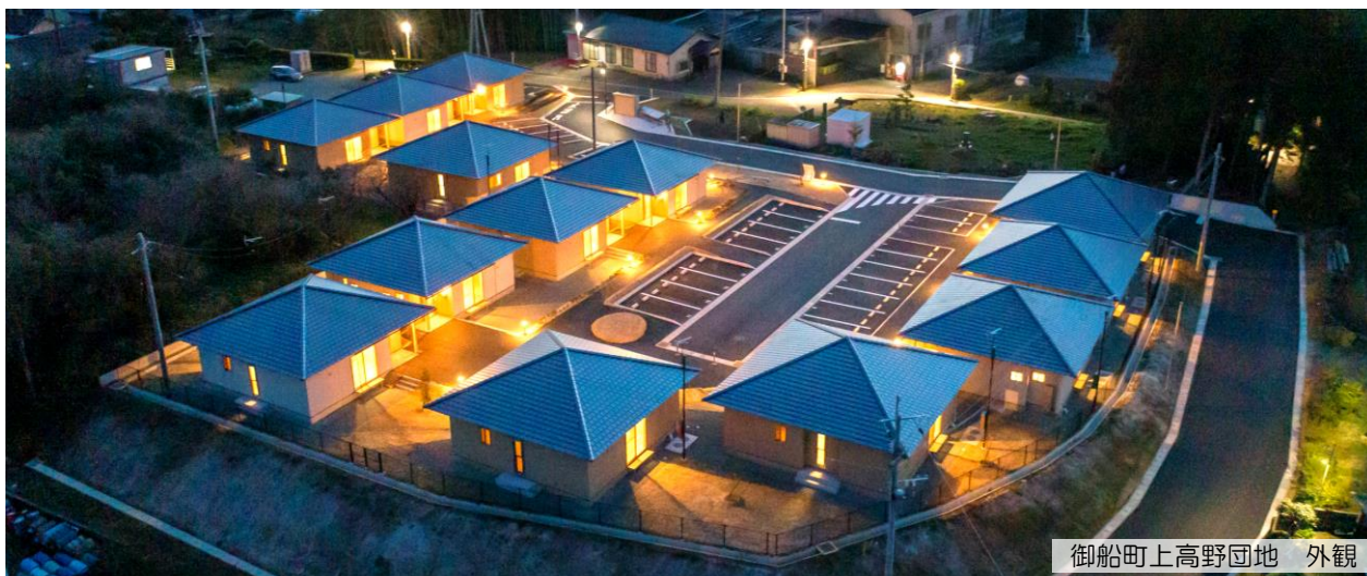
御船町上高野団地 外観