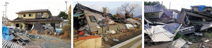
平成28年度熊本地震

熊本県では、今後の大地震に備え、皆様が安心して住み続けられる「すまい」の確保を図るため、戸建て木造住宅の耐震診断を実施しています。耐震診断士(耐震診断を行う方法を習得している建築士)がご自宅を訪問し、目視及び図面等により簡便な方法で地震に対する強さを診断(一般診断)します。