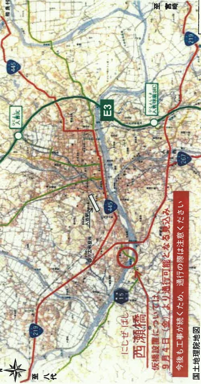
仮橋設置の状況(令和2年8月21日時点)