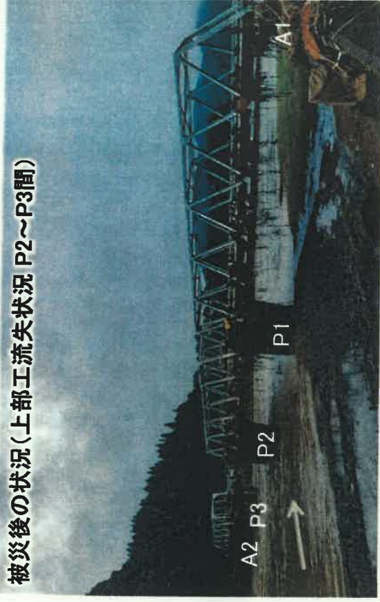
被災後の状況(上部工流失状況 P2~P3間)