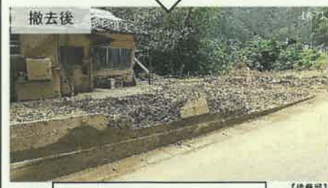
八代市坂本町地区