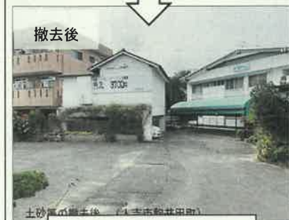
人吉市駒井田町地区