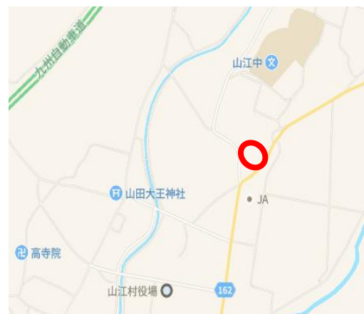
(仮称)中央グラウンド仮設団地 予定地

健康福祉政策課(すまい対策室) 廣石、緒方 [内線]7677 住宅課 佐澤、緒方 [内線]6250