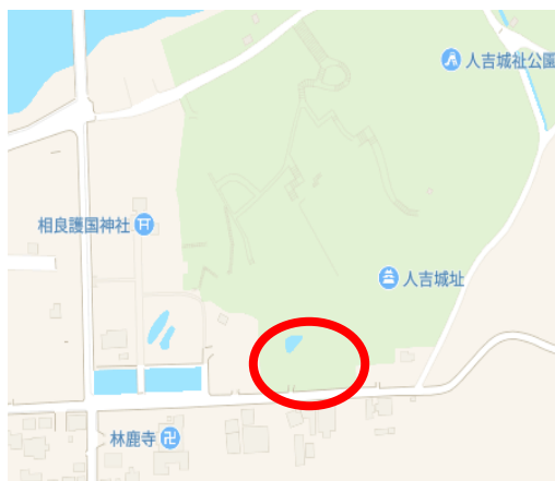
(仮称)人吉市人吉城跡仮設団地 予定地