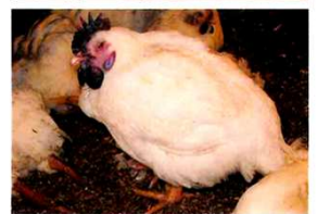
発症鶏・死亡鶏の例