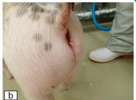
b 直腸体温測定後の肛門からの出血。柵にぶつかる等しても出血しやすくなる。