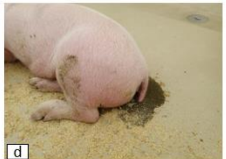
d 下痢症状を示す豚も多い。