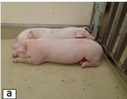
a 発熱、元気消失、食欲不振、豚同士で集まって壁際にうずくまる。

・豚同士の直接又は間接的な接触、あるいは感染豚由来の肉製品を給餌することにより伝搬します。