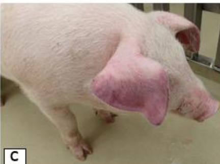
c 耳翼の紅斑。斃死前にはチアノーゼに変わる。